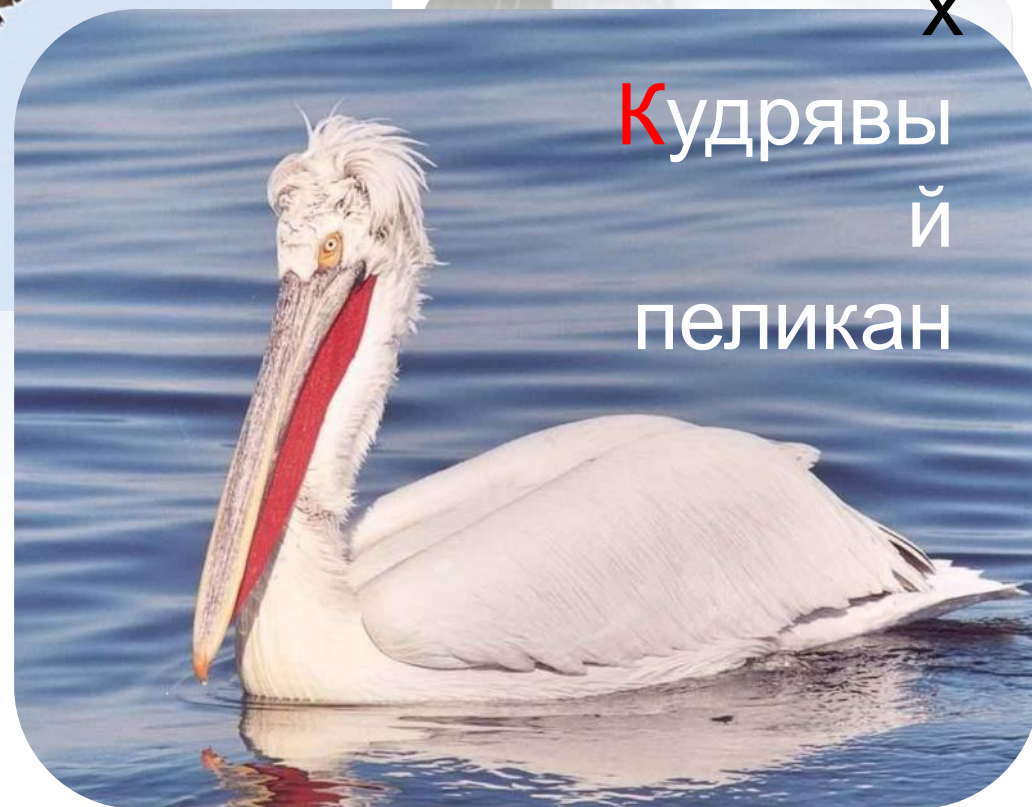
Кудрявы й пеликан