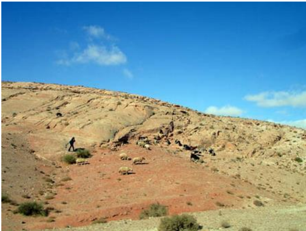
Пустыня Вади Рам