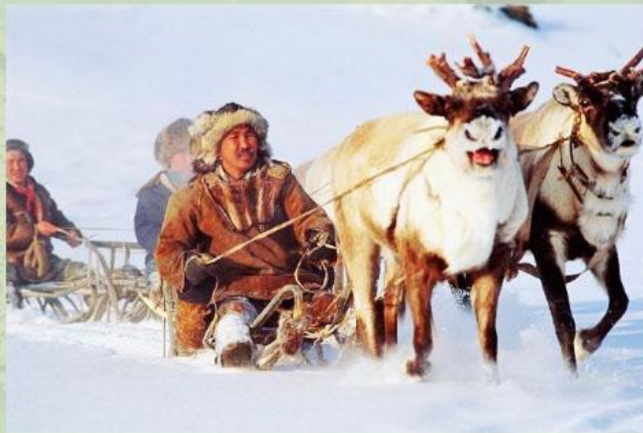
Оленья упряжка - основное средство передвижения в Арктике.