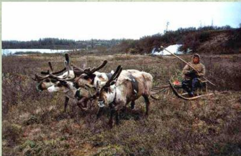
Ненцы - жители Севера.