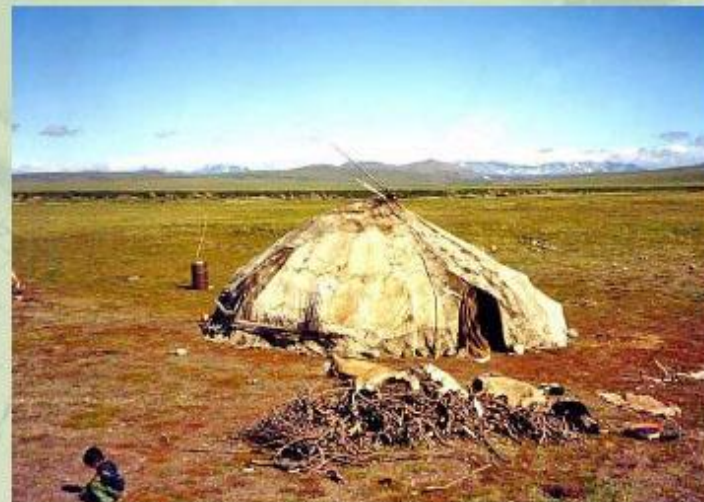
Чум, крытый оленьими шкурами - традиционное жилище народов Севера.

Малочисленные народы Севера проживают в крайне суровых условиях. Подробнее познакомиться с жизнью малых народов, их бытом и культурой вы сможете, прочитав энциклопедическую статью.