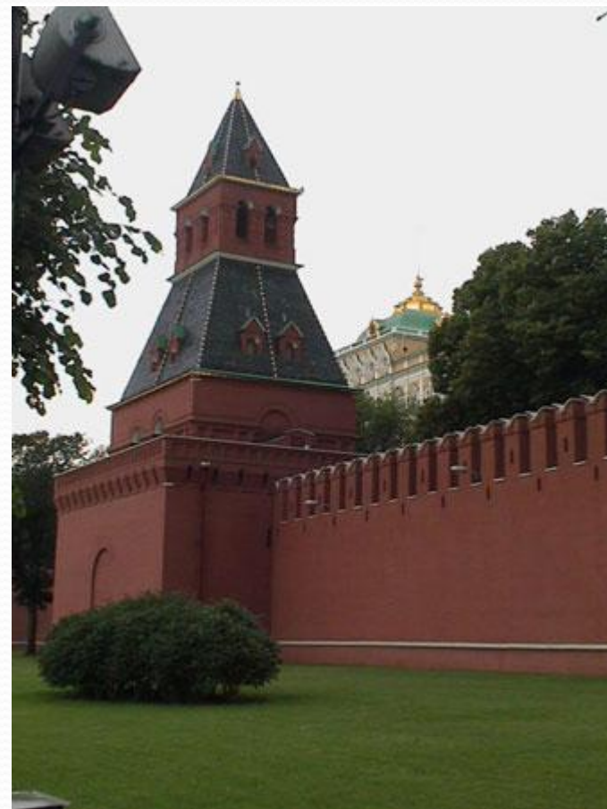
Тайницкая башня Московского Кремля

Первой башней, которая была заложена при строительстве Кремля, была Тайницкая. Тайницкая башня названа так потому, что от неё к реке вёл тайный подземный ход. Предназначался он для того, чтобы можно было брать воду в случае если крепость осадят враги. Высота Тайницкой башни 38,4 м.