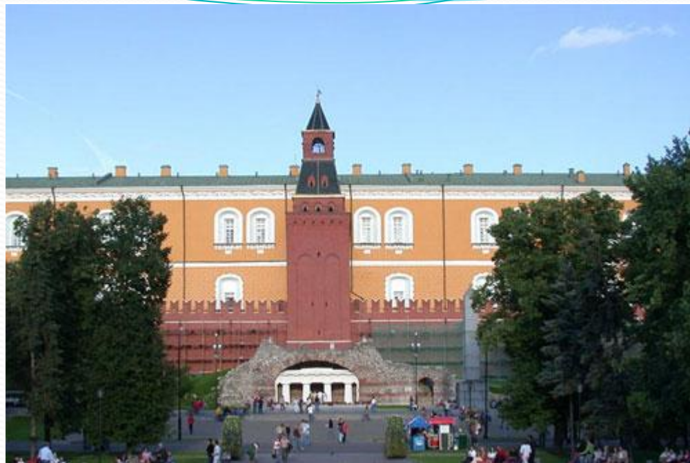
Средняя Арсенальная башня Московского Кремля

Средняя Арсенальная башня. Её построили в 1493-1495 гг. После постройки здания Арсенала башня получила своё название. Возле башни в 1812 г. был возведён грот – одна из достопримечательностей ей Александровского сада. Высота башни 38,9м.