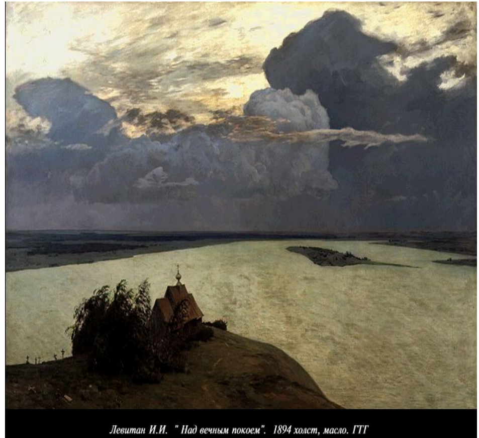
Левитан И.И. "Под вечным покоем". 1894 холст, масло. ГТГ