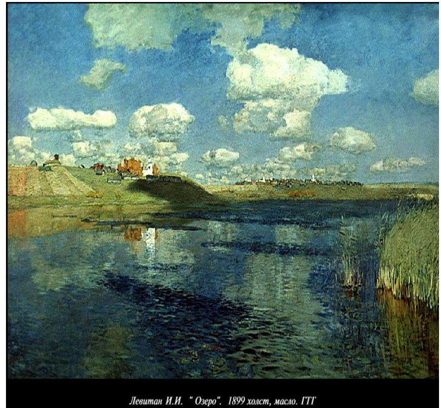
Левитан И.И. "Озеро". 1899 холст, масло. ГТГ