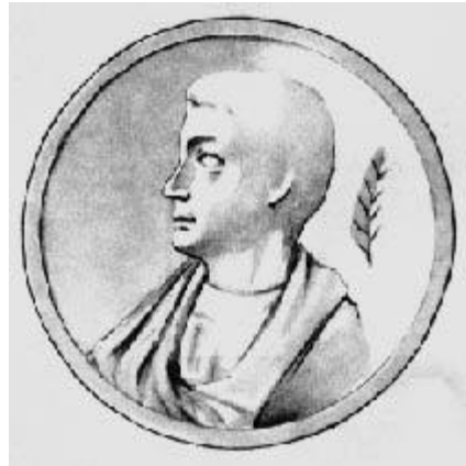
Гораций Квинт Флакк 65 - 8 до н.э.

Памятник продолжает традицию горацианского “Elegi monumentum” (ода «К Мельпомене») – эти слова использованы Пушкиным в качестве эпиграфа