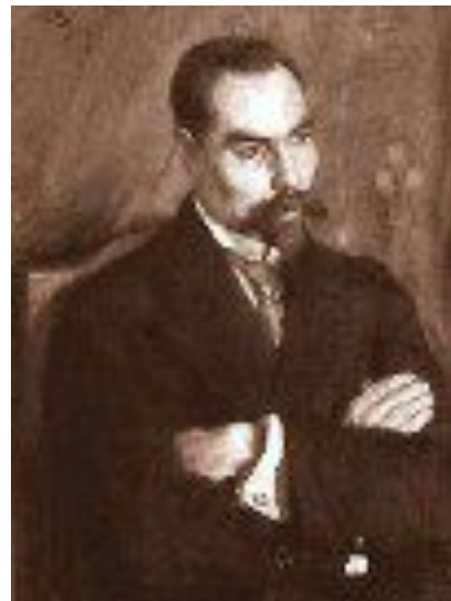
БРЮСОВ Валерий Яковлевич □