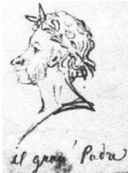
Автопортрет. 1835-36 (?)

(21 августа 1836г., при жизни поэта не опубликовано)