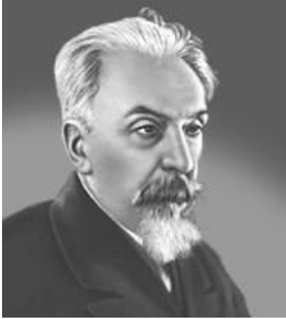
ЩЕРБА Лев Владимирович [1880-1944]