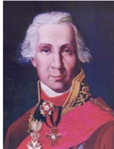
ДЕРЖАВИН Гавриил Романович [1743-1816]