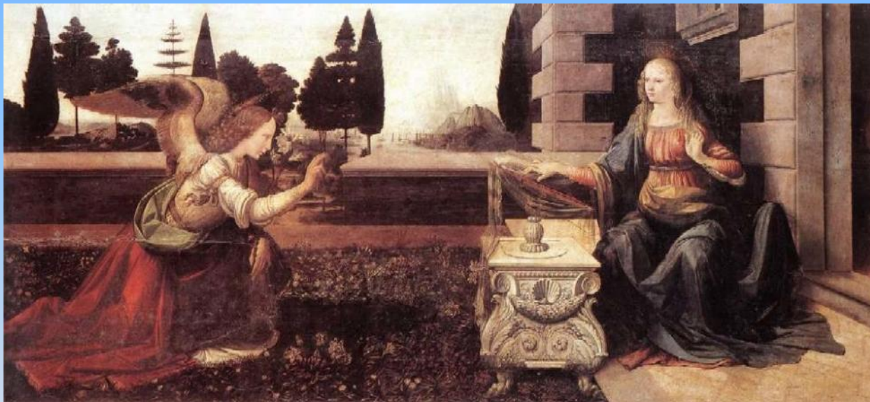
Леонардо да Винчи «Благовещение»

Какая картина, по вашему мнению, наиболее близка к стихотворению “Ангел”?