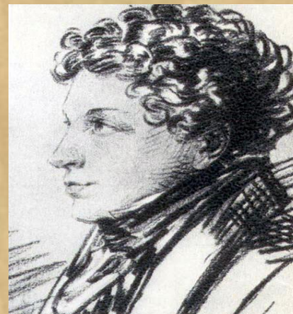
БРАТ , Лев Сергеевич Пушкин.