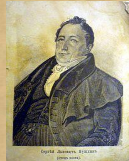
ОТЕЦ , Сергей Львович Пушкин.