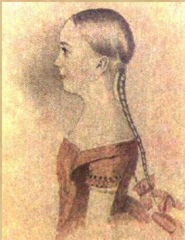
Мария Александровна Пушкина.