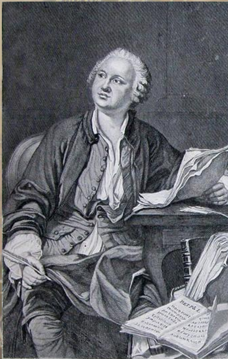
Грав. И. Ф. Дейнгогеръ.