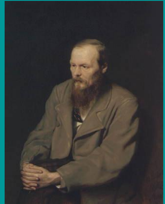
Ф. М. Достоевский

Критический реализм - течение, возникшее в Германии в конце 19 века и специализирующееся на теологической интерпретации современного естествознания (попытки примирить знание с верой и доказать «несостоятельность» и «ограниченность» науки).