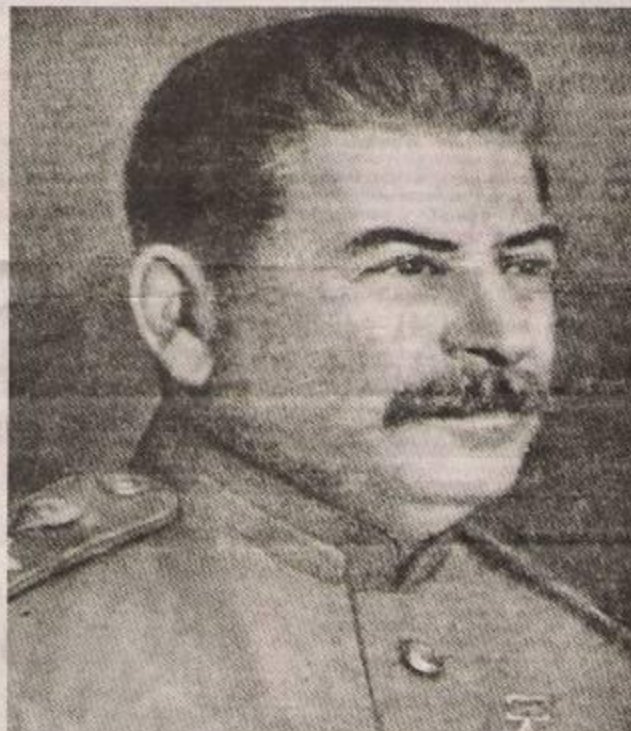
И. В. Сталин.

ГАЗЕТА МОСКОВСКОГО ГОРОДСКОГО КОМИТЕТА ВКП(б) И МОССОВЕТА