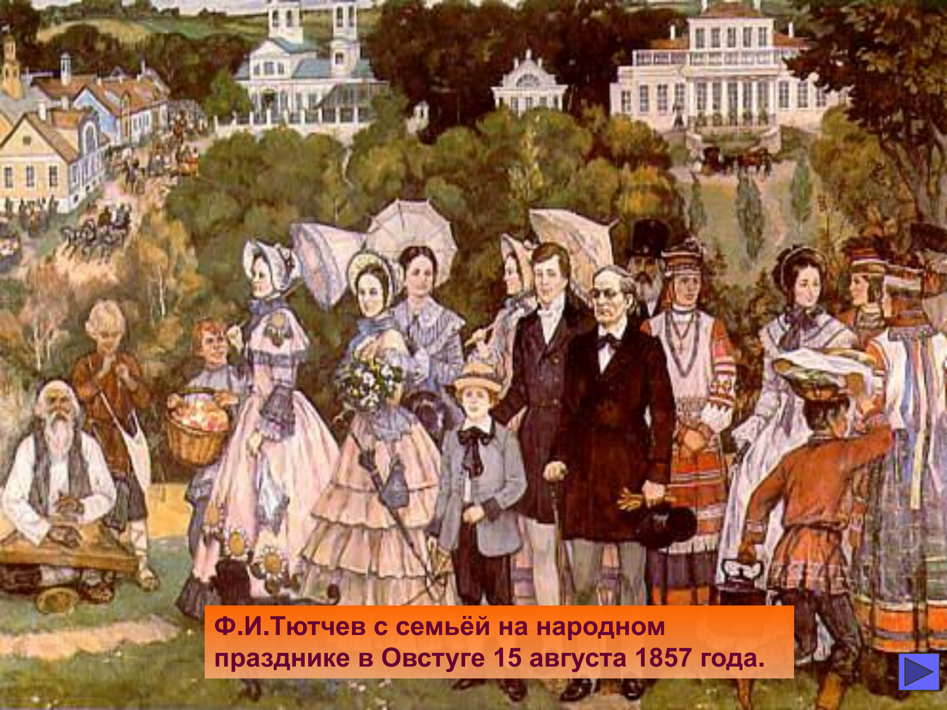
Ф.И.Тютчев с семьёй на народном празднике в Овстуге 15 августа 1857 года.