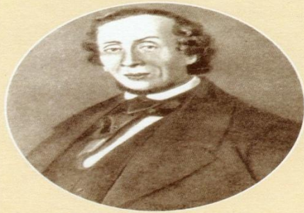
Андерсен в 1840-е г.г.

Вершиной творчества Ханса Кристиана Андерсена стали сказки. Датский физик Х.К. Эрстед, прочитав первый выпуск сборника «Сказки, рассказанные детям», заметил: «Импровизатор» прославил вас, сказки сделают ваше имя бессмертным!». Со сказками к Х.К. Андерсену пришла слава, «... начало этой славы следует отнести к 1835 году, когда Андерсен словами: «Шёл солдат по дороге: раз-два! Раз-два!» вступил в царство сказок». Первый сборник сказок назывался «Сказки, рассказанные детям» (1835 — 1837), второй — «Новые сказки» (1844 — 1848), третий — «Истории» (1852 — 1855), четвёртый — «Новые сказки и истории» (1858 — 1872). Всего Андерсен написал более ста семидесяти сказок и историй.