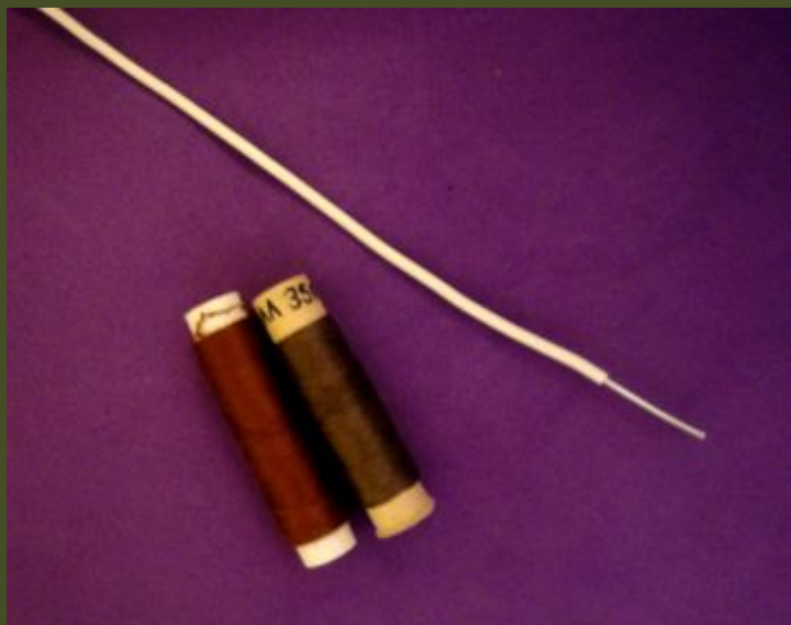
НИТКИ, ПРОВОЛОКА АЛЮМИНИЕВАЯ