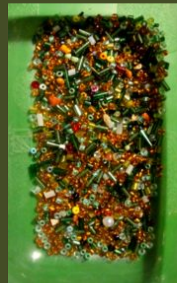
БИСЕР, БУСИНЫ РАЗНОГО РАЗМЕРА