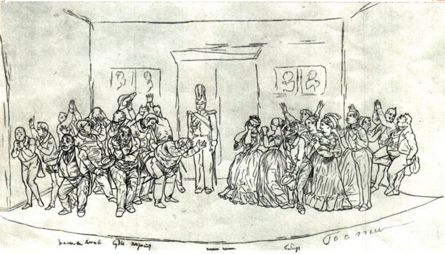
«РЕВИЗОР». ЗАКЛЮЧИТЕЛЬНАЯ СЦЕНА. Рисунок Н. В. Гоголя (?)