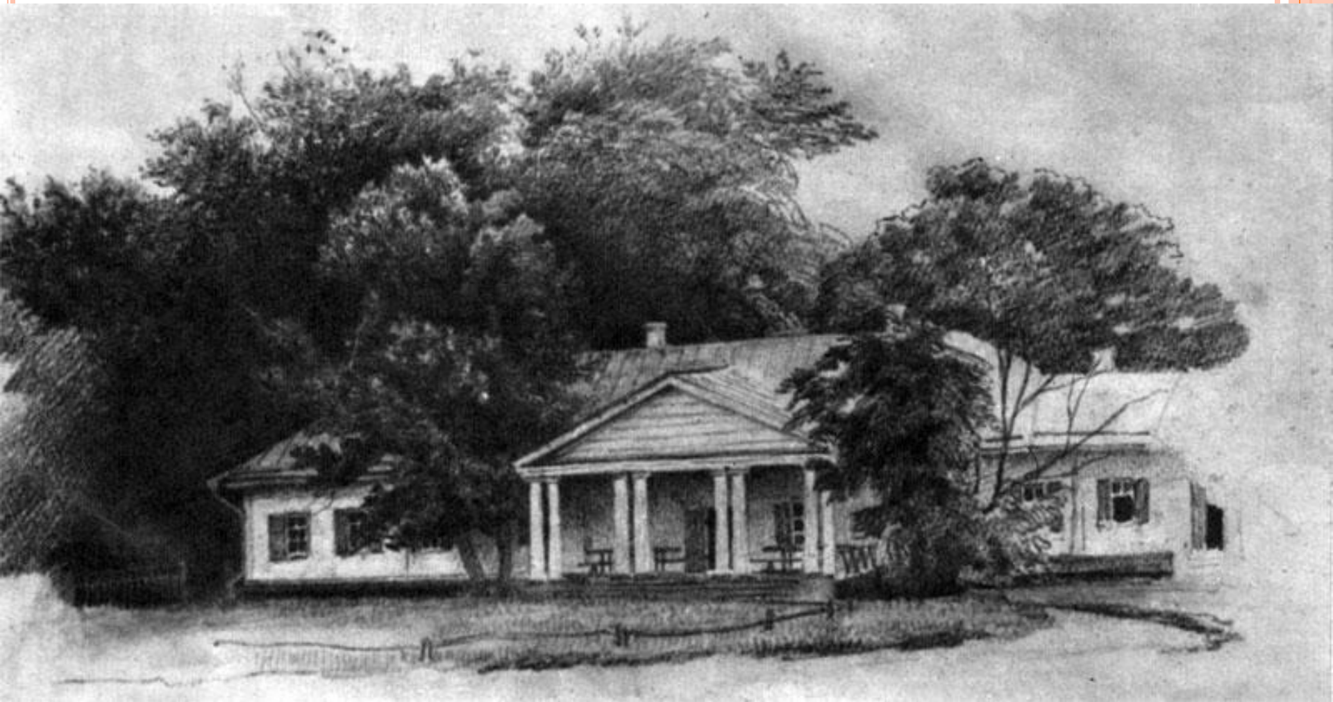
ДОМ В ВАСИЛЬЕВКИ