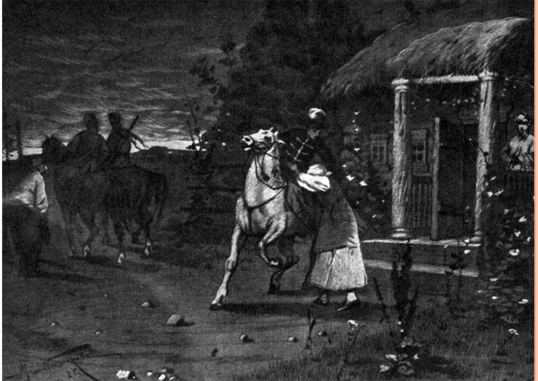
Отъезд Тараса Бульбы с сыновьями.