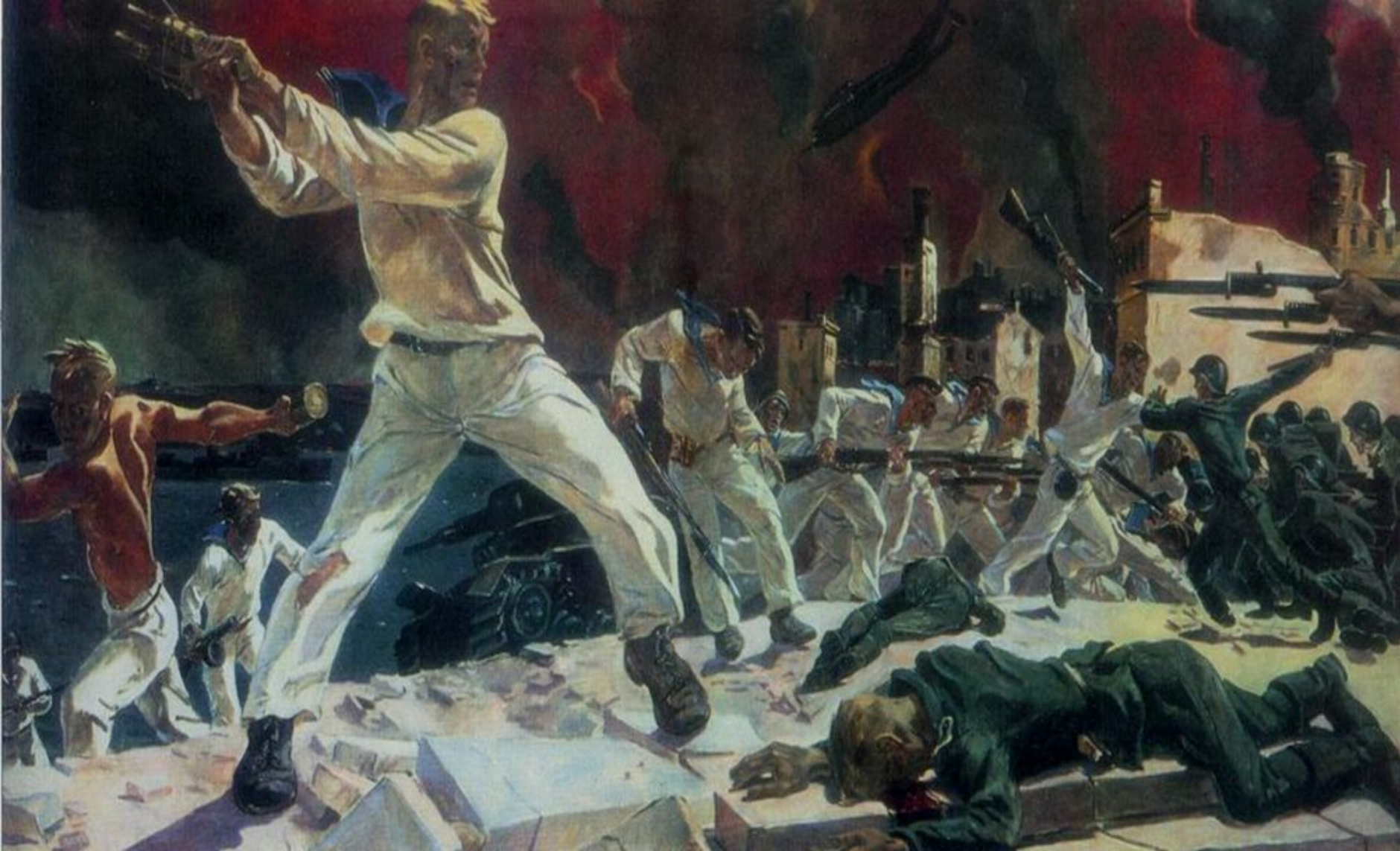
А. А. ДЕЙНЕКА «ОБОРОНА СЕВАСТОПОЛЯ», 1942