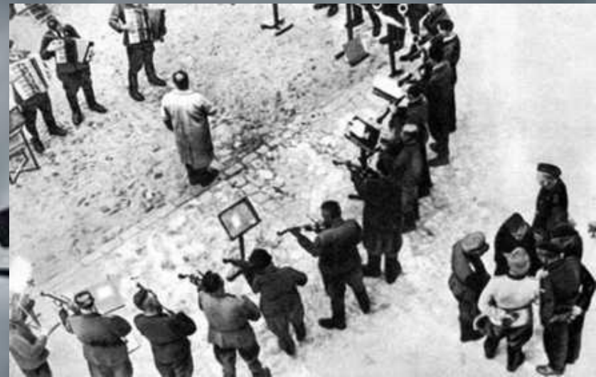
Оркестр з ув'язнених (Яновський табір)