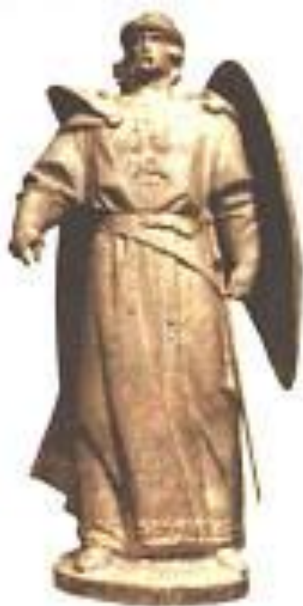
Так виглядають знахідки кміського архидіакона Аскальда