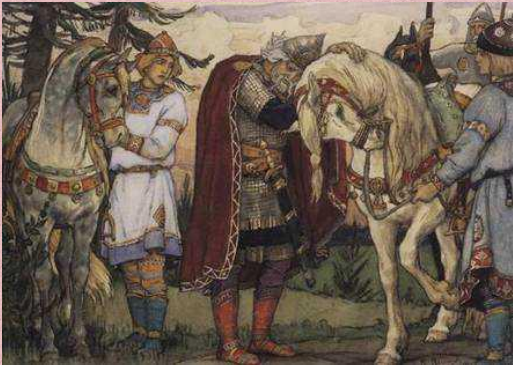
В. Васнецов. Прощання князя Олега з конем.