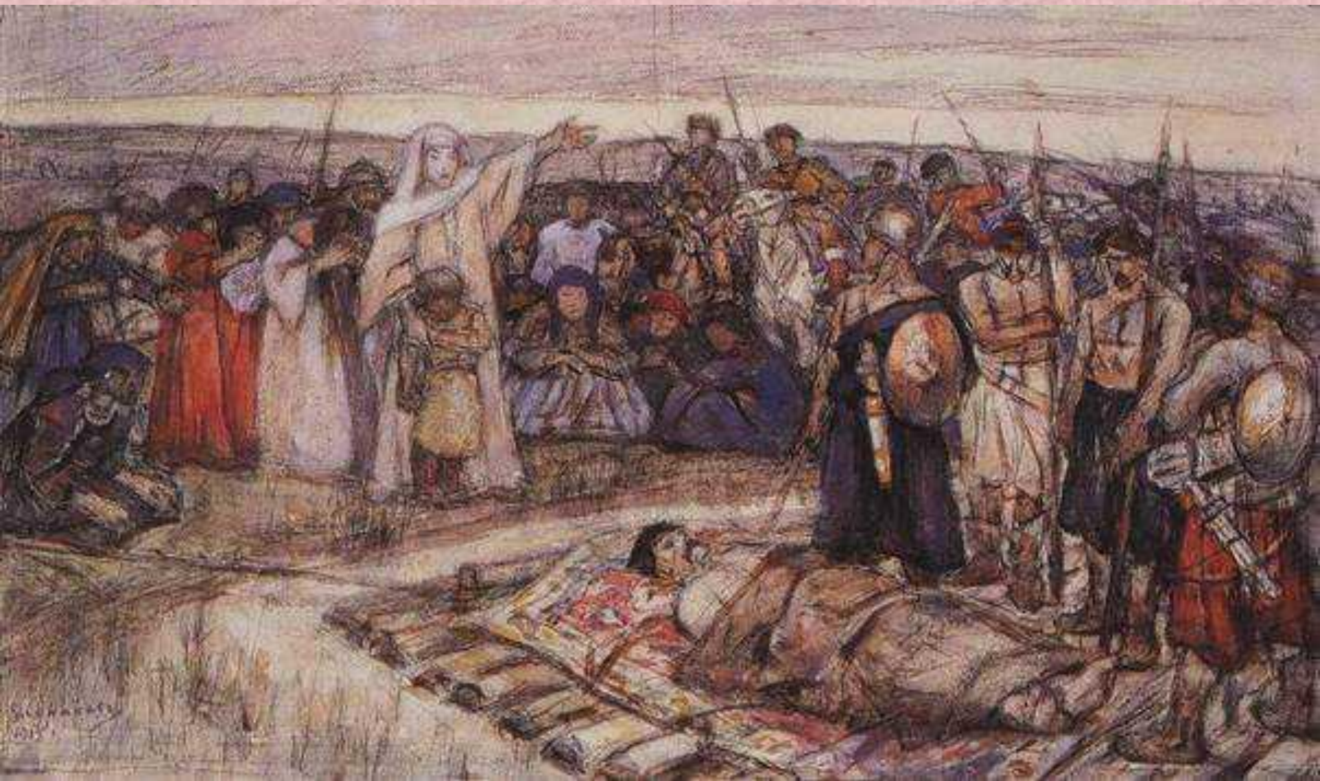
В.Суриков Княгиня Ольга зустрічає тіло князя Ігоря (ескіз)