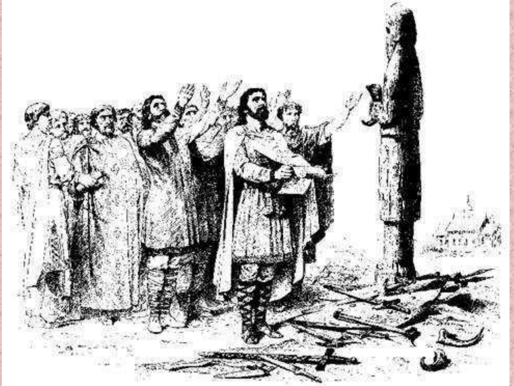
Князь ігор перед ідолом Перуна після походу на Константинополь