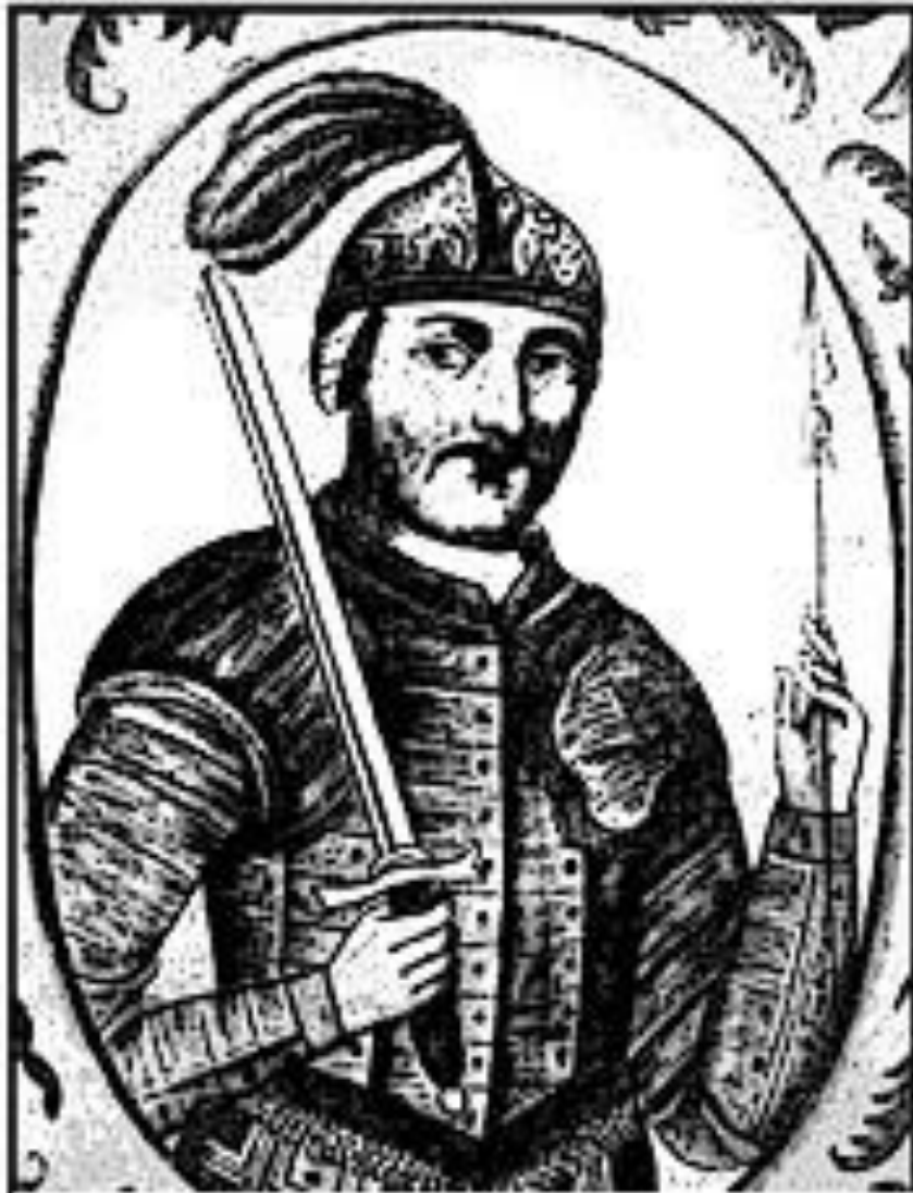
Ігор. Малюнок 17 ст.

Після смерті Олега князувати на Русі почав син Рюрика — Ігор