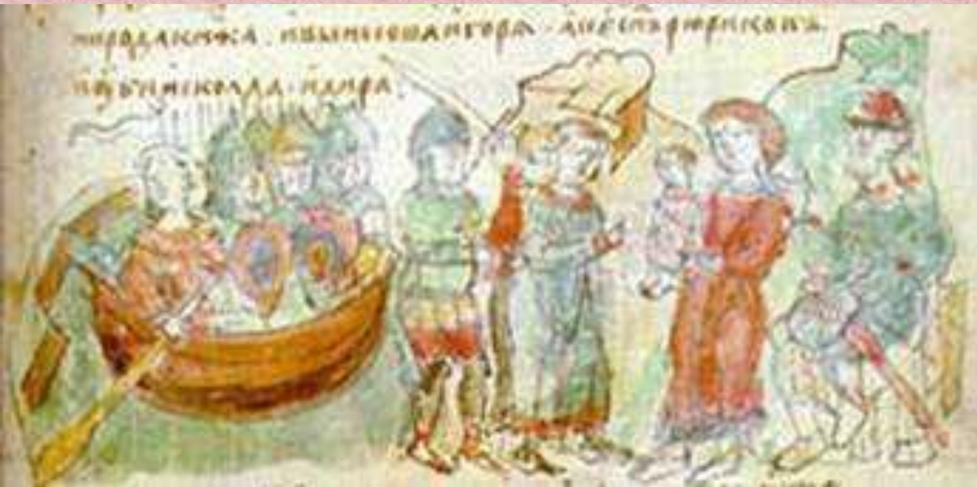
Убивство Аскольда й утвердження Олега в Києві. Малюнок із літопису