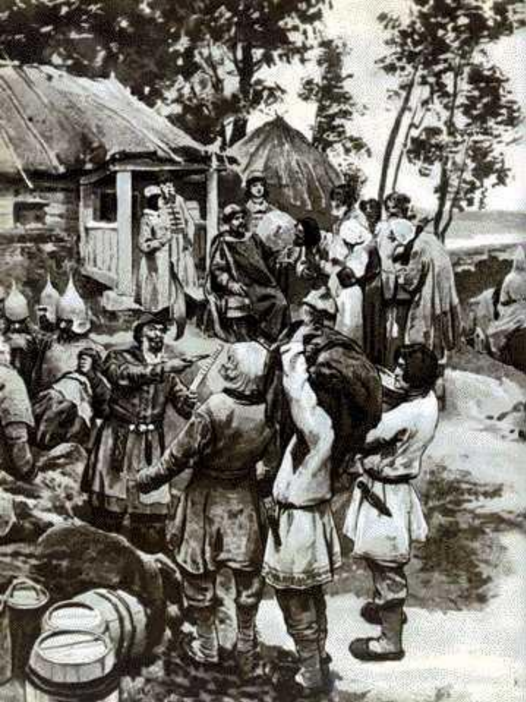
Полюддя (фрагмент картини К. Лебедєва).