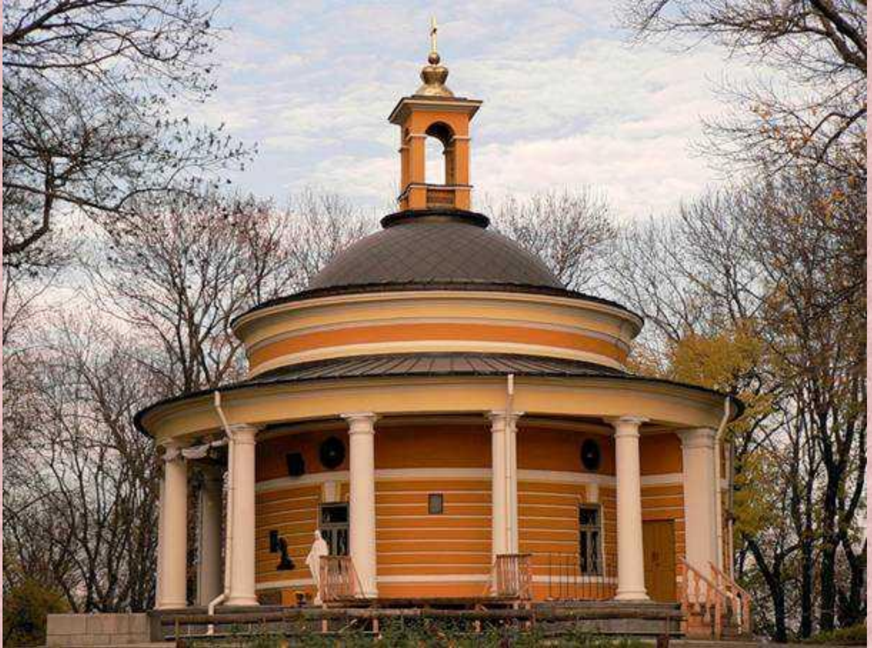
Аскольдова могила (Київ, сучасний вигляд)