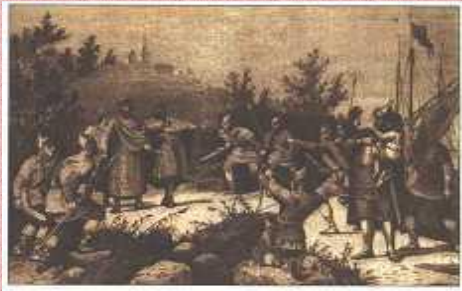
Вбивство Аскольда новгородцями