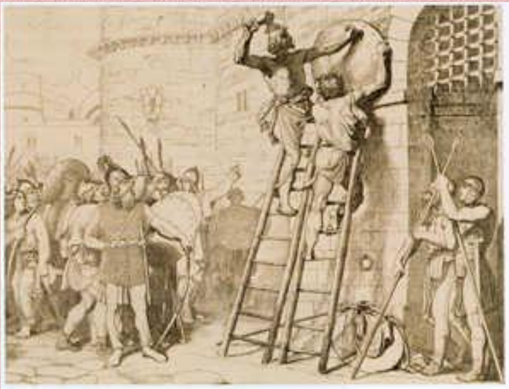
Олег прибыває свій щит на воротах Константинополя.