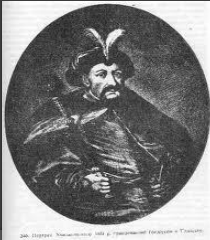
246. Портрет Хмельницького 1648 р. гравюра на металі. Голландія - Токіо.