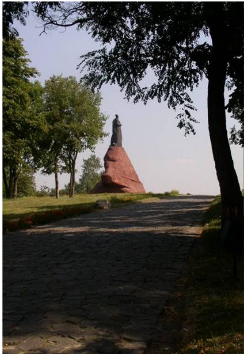
Пам'ятник С.А. Ковпаку в м. Путивль