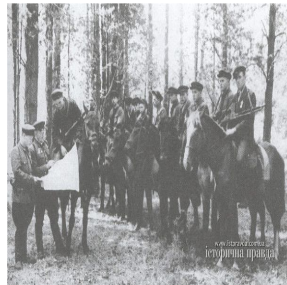
Кінний розвідувальний відділ радянських партизанів.