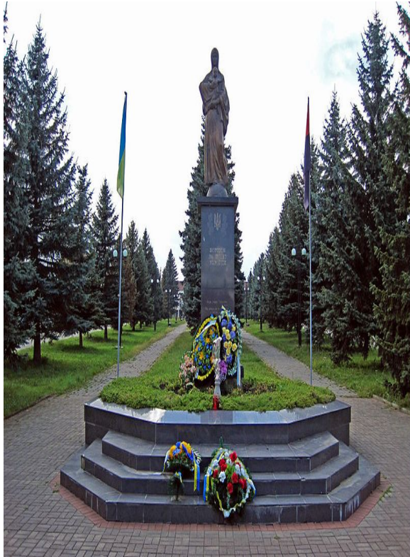
Борцям за волю України в Івано-Франківську