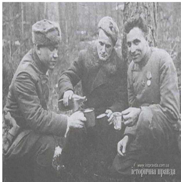
Командири з' єднання Ковпака на привалі