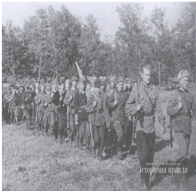
З'єднання Ковпака вирушає в Карпатський рейд