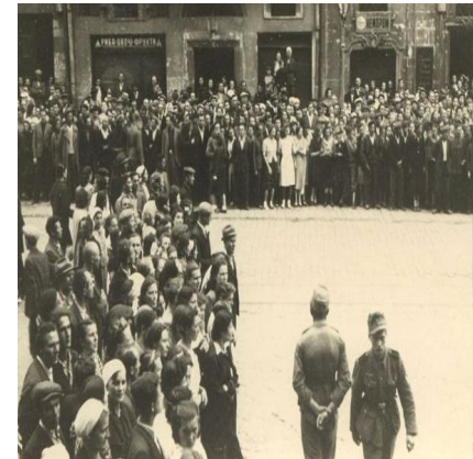
30 червня 1941 року. Львів'яни в очікуванні проголошення Акту відновлення державності

Хай живе Суверенна Соборна Українська Держава, хай живе Організація Українських Націоналістів, хай живе Провідник Організації Українських Націоналістів Степан Бандера! Слава Україні! Героям Слава!