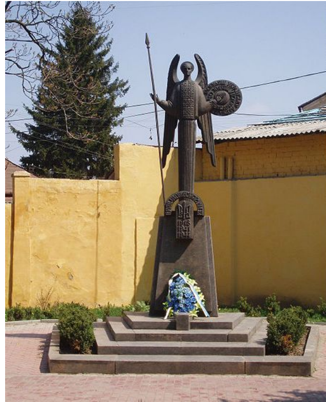
Героям буковинського куреня Чернівці