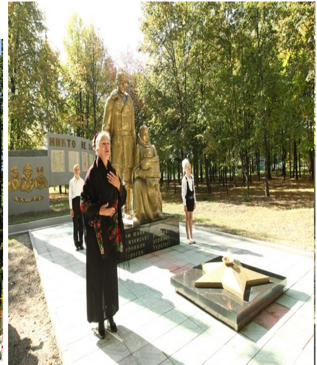
Пам'ятник "Партизанська сім'я" в с. Єліне на Чернігівщині