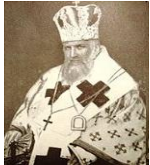
Андрей Шептицький Кардинал УГКЦ