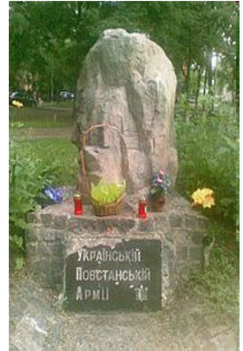
Пам'ятний знак на честь УПА в Харкові