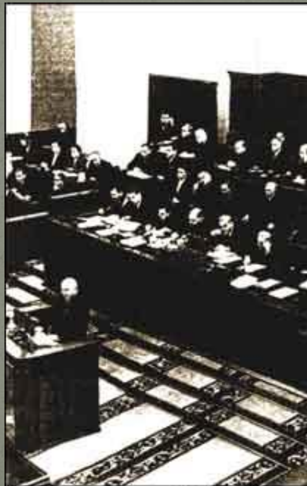
М.Хрущов під час XX з'їзду КПРС. Лютий 1956р.