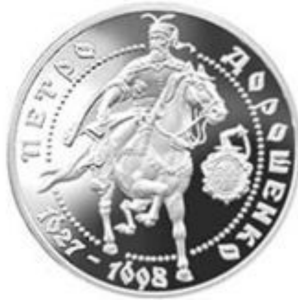
Монета 10 гривень на пам'ять Петра Дорошенка