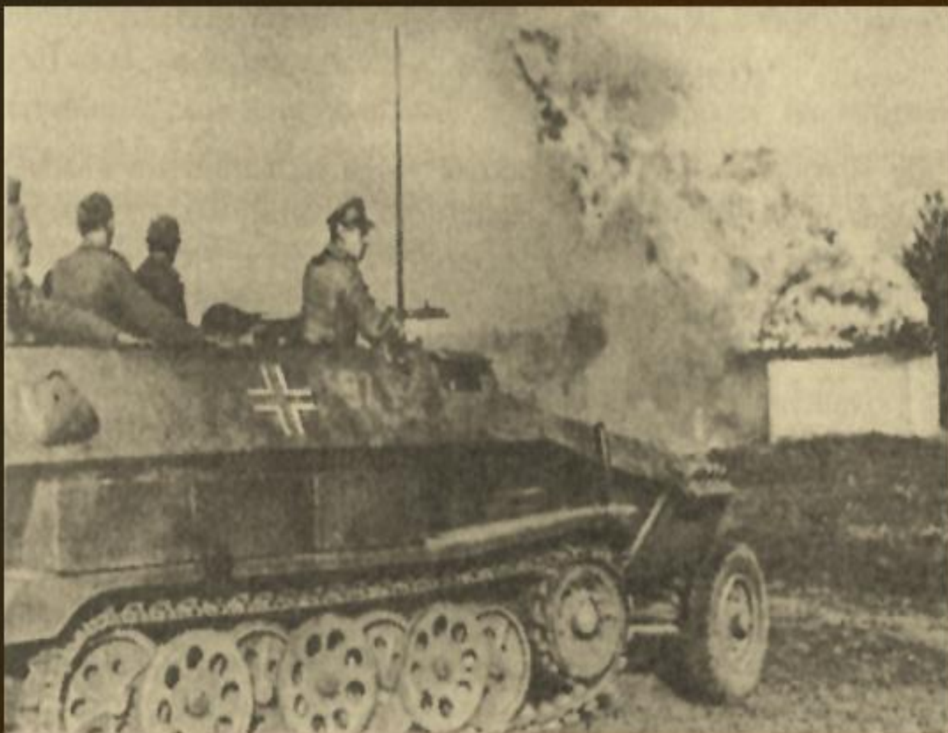
фашистські карателі спалюють українське село, 1942 р.