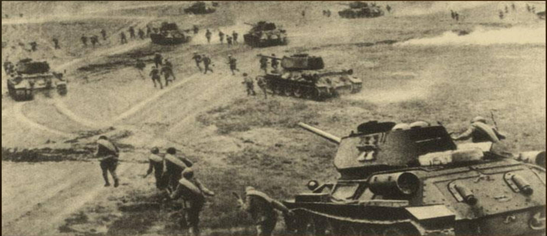
танкова атака на Курській дузі, 1943 р.