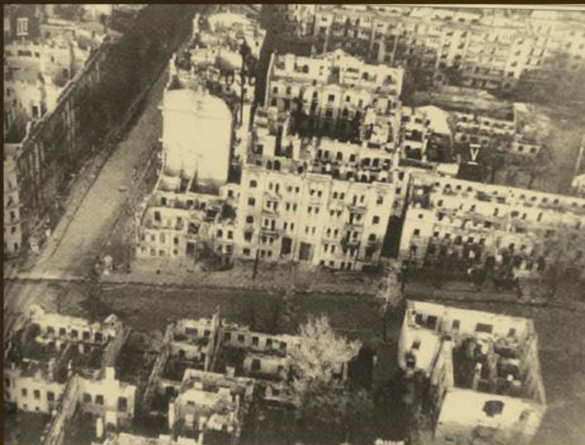
Київ, на розі вулиць Лютеранської та Заньковецької, листопад 1941 р.