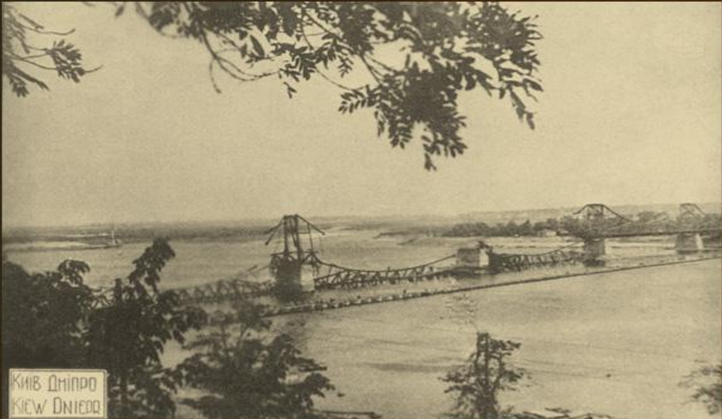
Київ, Дніпро, поштова картка 1942 р.