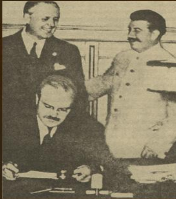
Нарком закордонних справ СРСР В. М. Молотов підписує радянсько-німецький договір про ненапад, 23 серпня 1939 р.