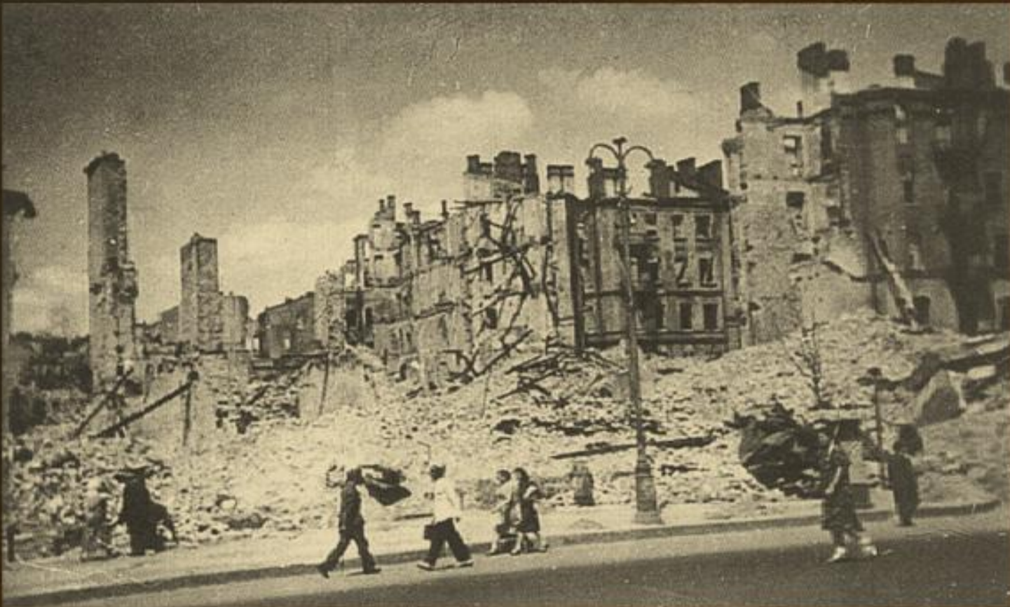
Хрещатик, ріг Прорізної вулиці, 1942 р.