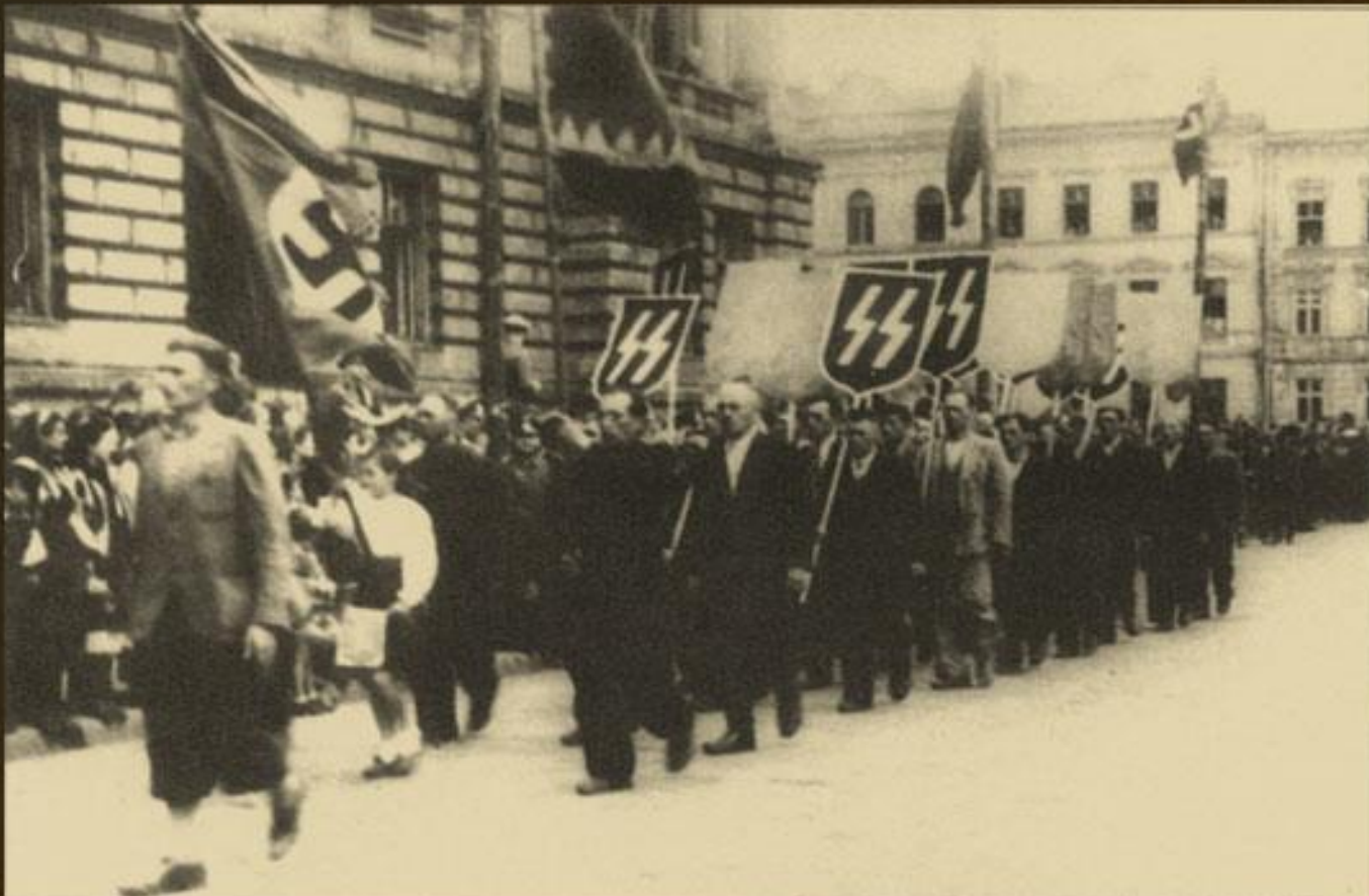
мітинг-парад з нагоди початку формування дивізії СС "Галичина", Львів, 1943 р.