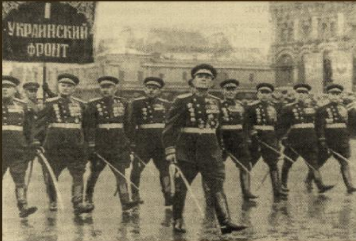
війська 1-го Українського фронту на параді Перемоги в Москві, 24 червня 1945 р.