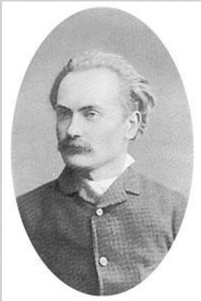
Іван Якович Франко