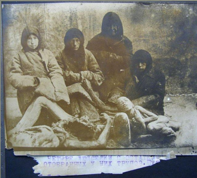
ЧЕТЫРЕ ПОЛОБЕДКИ С ОСТАТКАМИ ОТОВАРЕННЫХ У НИХ ТРУДОВ. ПУД

Трудящі міста допомагали відбудувати важливі підприємства республіки . Так, в лютому 1921 року на загальних зборах службовців радянських установ Білої Церкви було вирішено відрахувати 25% місячної зарплати для відбудови шахт Донбасу. З місячного фонду було направлено для робітників хліб, сіль, цукор.