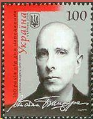
Поштова марка до 100-річчя від дня народження