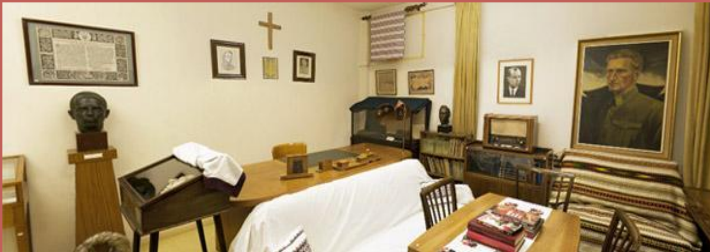
Музей Степана Бандери у Лондоні