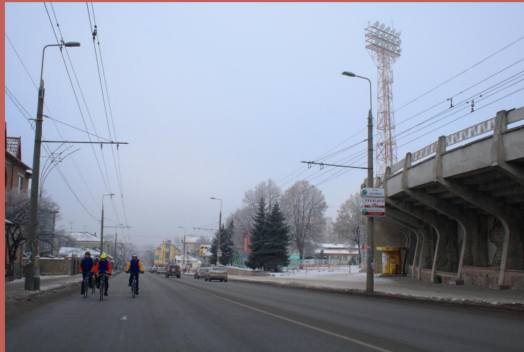
Проспект Степана Бандери у Тернополі