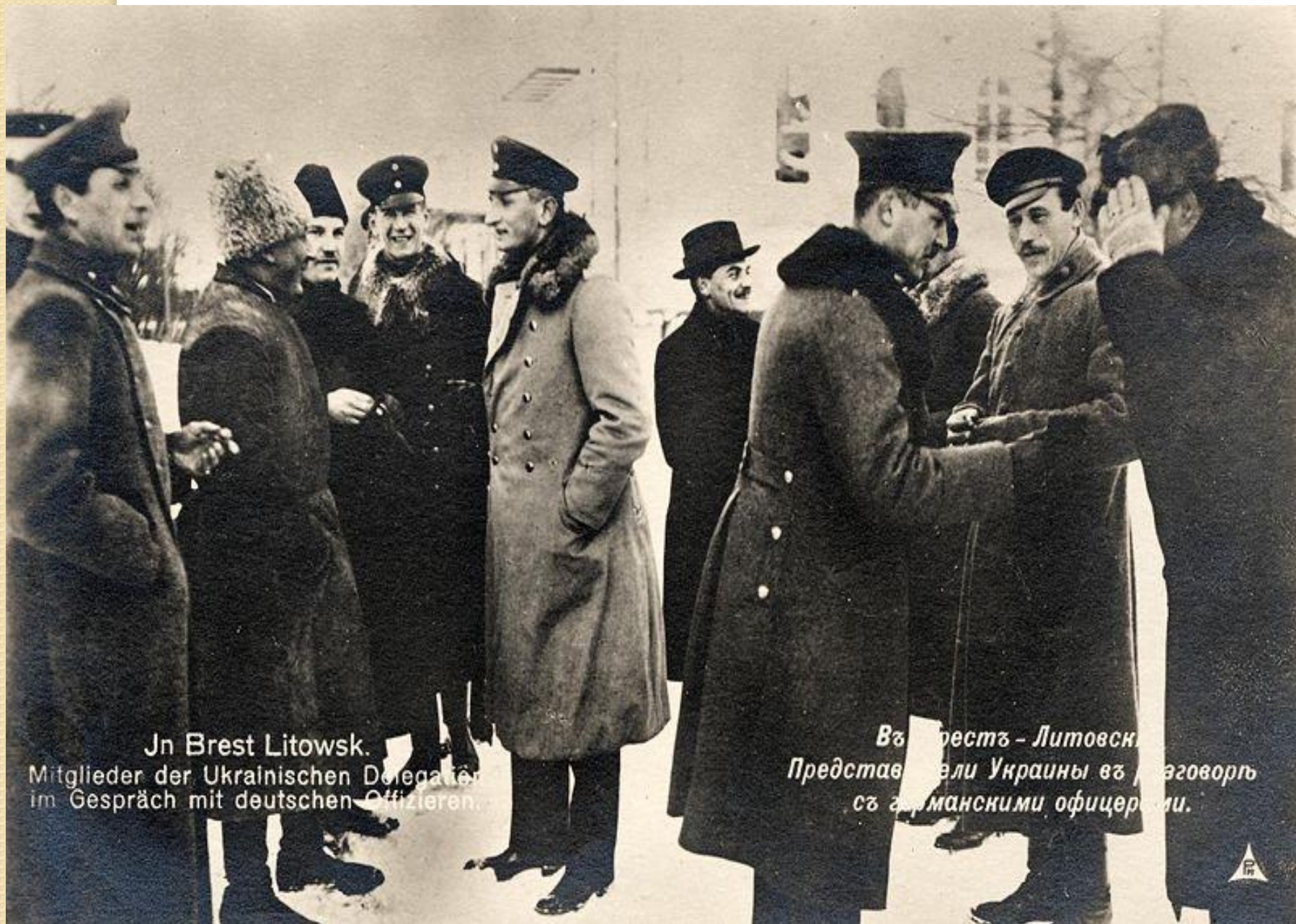
In Brest Litowsk. Mitglieder der Ukrainischen Delegation im Gespräch mit deutschen Offizieren.