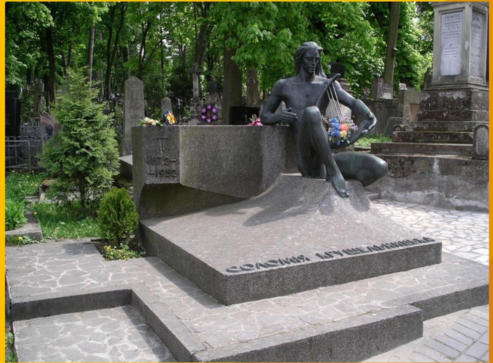
Могила Соломії Крушельницької у Львові на Личаківському кладовищі

Поховали С. А. Крушельницьку у Львові на Личаківському кладовищі поруч з могилою друга і наставника — Івана Франка.