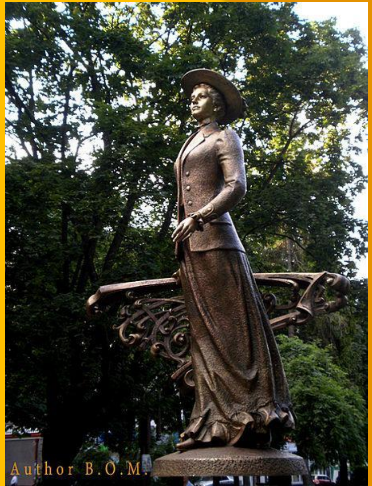
Пам'ятник Соломії Крушельницькій у Тернополі