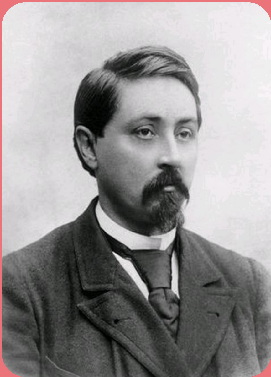
Дмитрий Наркисович Мамин – Сибиряк (1852 – 1912 г.г.)