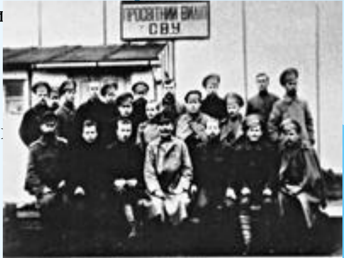
Члени товариства "Просвіта"

Зусиллями української інтелігенції після Лютневої революції 1917 р. поширювали національні культурно-освітні організації - «Просвіти», які найбільш активно діяли серед сільського населення. «Просвіти» організовували бібліотеки, драмгуртки, хорові колективи, лекторії тощо.