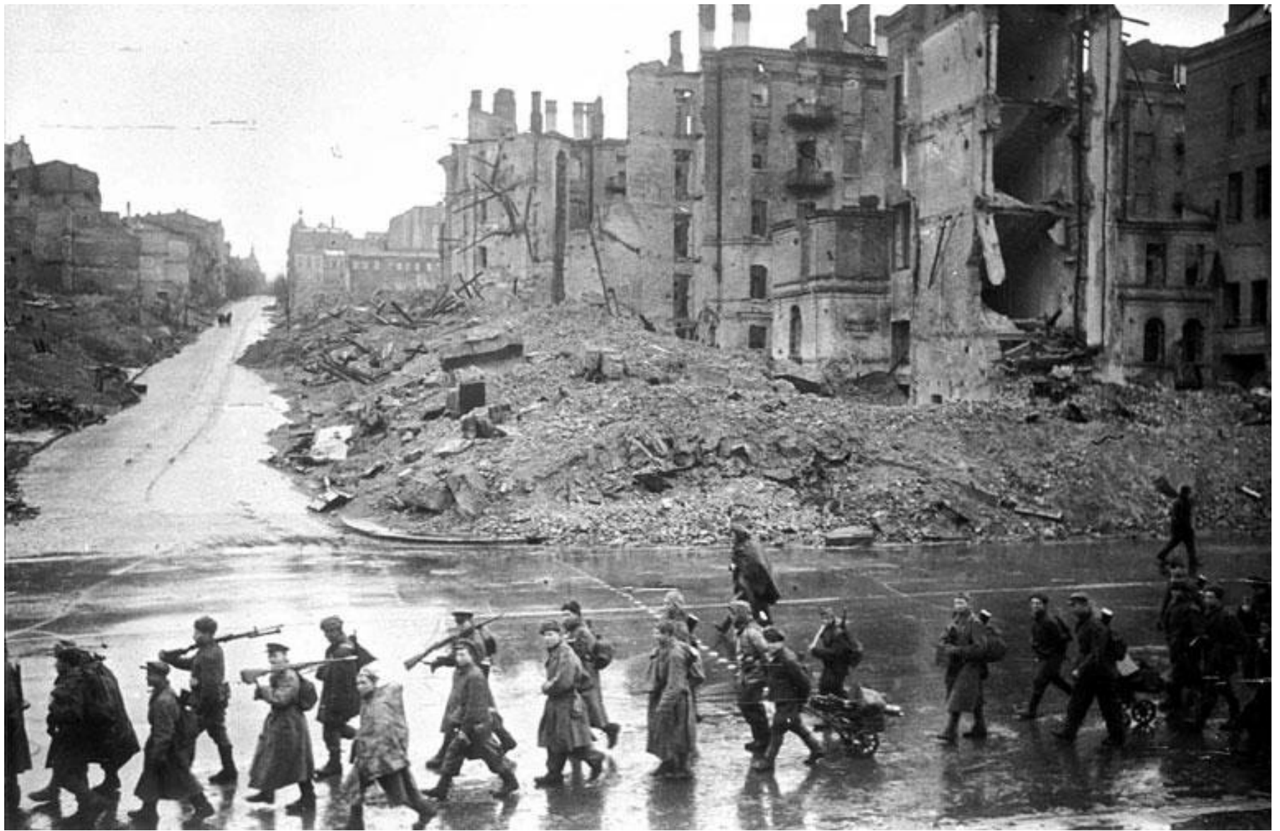
Радянські війська у звільненому Дніпропетровську