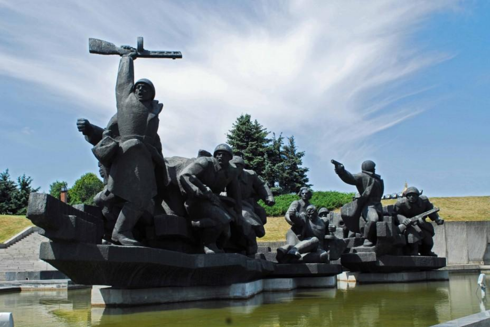
Скульптурна композиція "Форсування Дніпра"