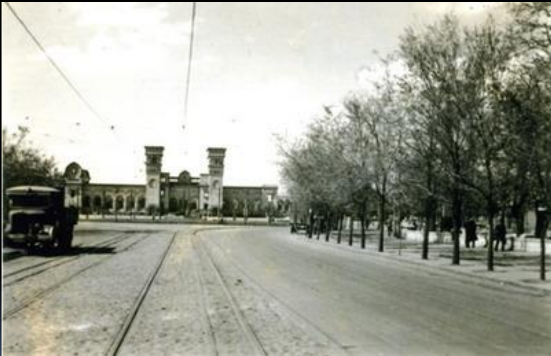
Дніпропетровськ в роки німецької окупації