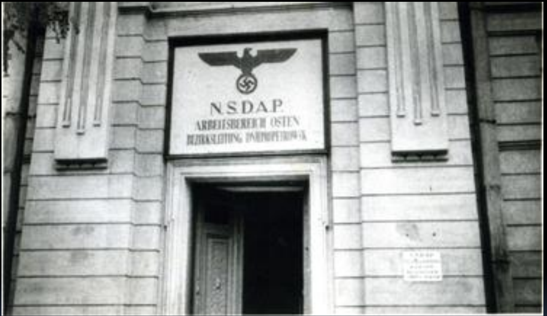
Дніпропетровськ в роки німецької окупації