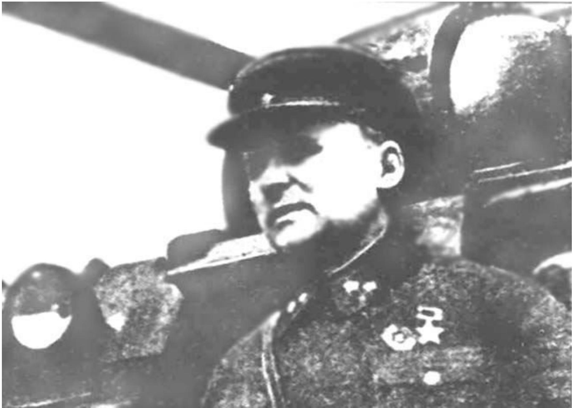
Командир 8-ої танкової дивізії Ю. Г. Пушкін. 1941 рік