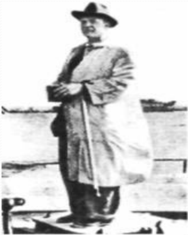
О.Довженко на будівництві Каховської ГЕС