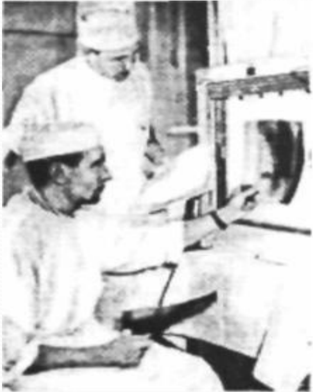
Відомий хірург академік М.Амосов (на передньому плані)