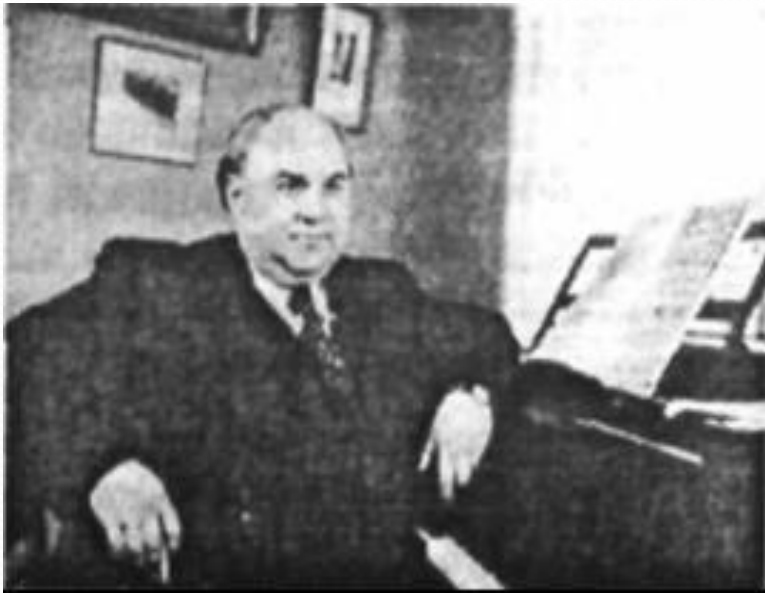
К. Данькевич – український радянський композитор