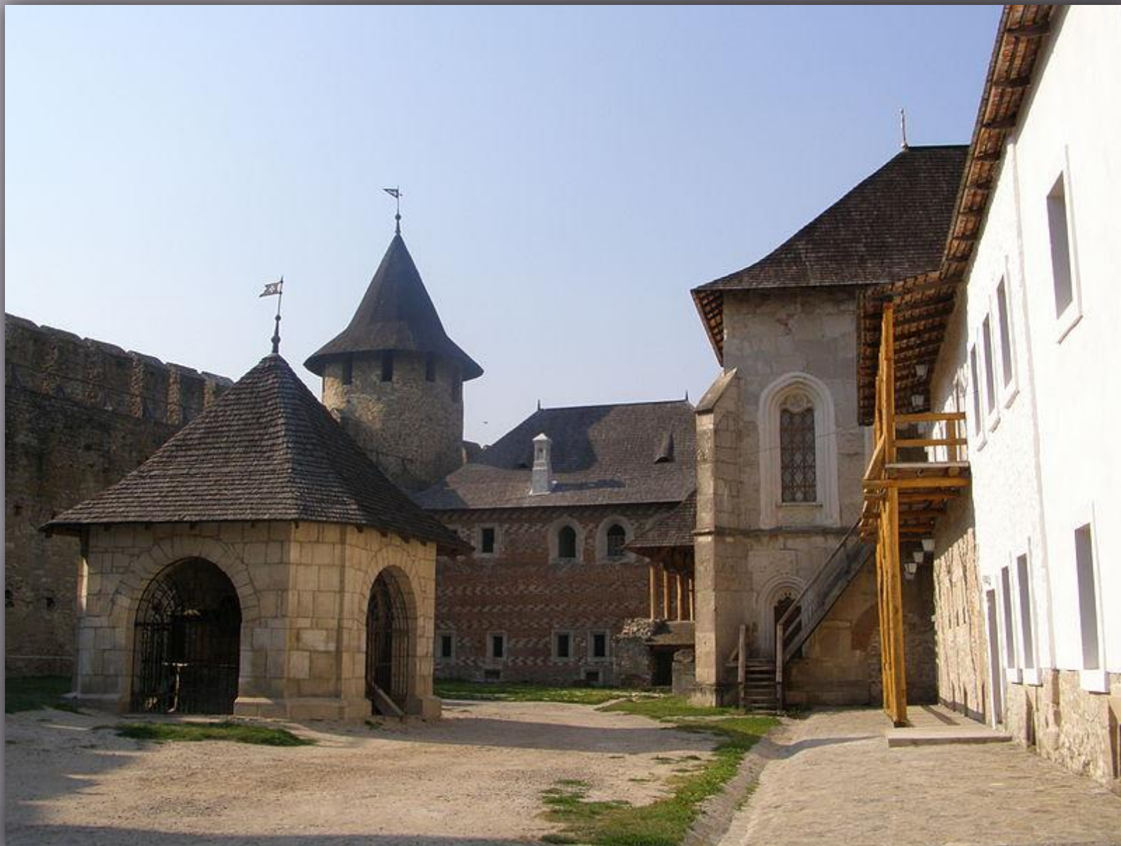
Хотинська фортеця. Вид із середини