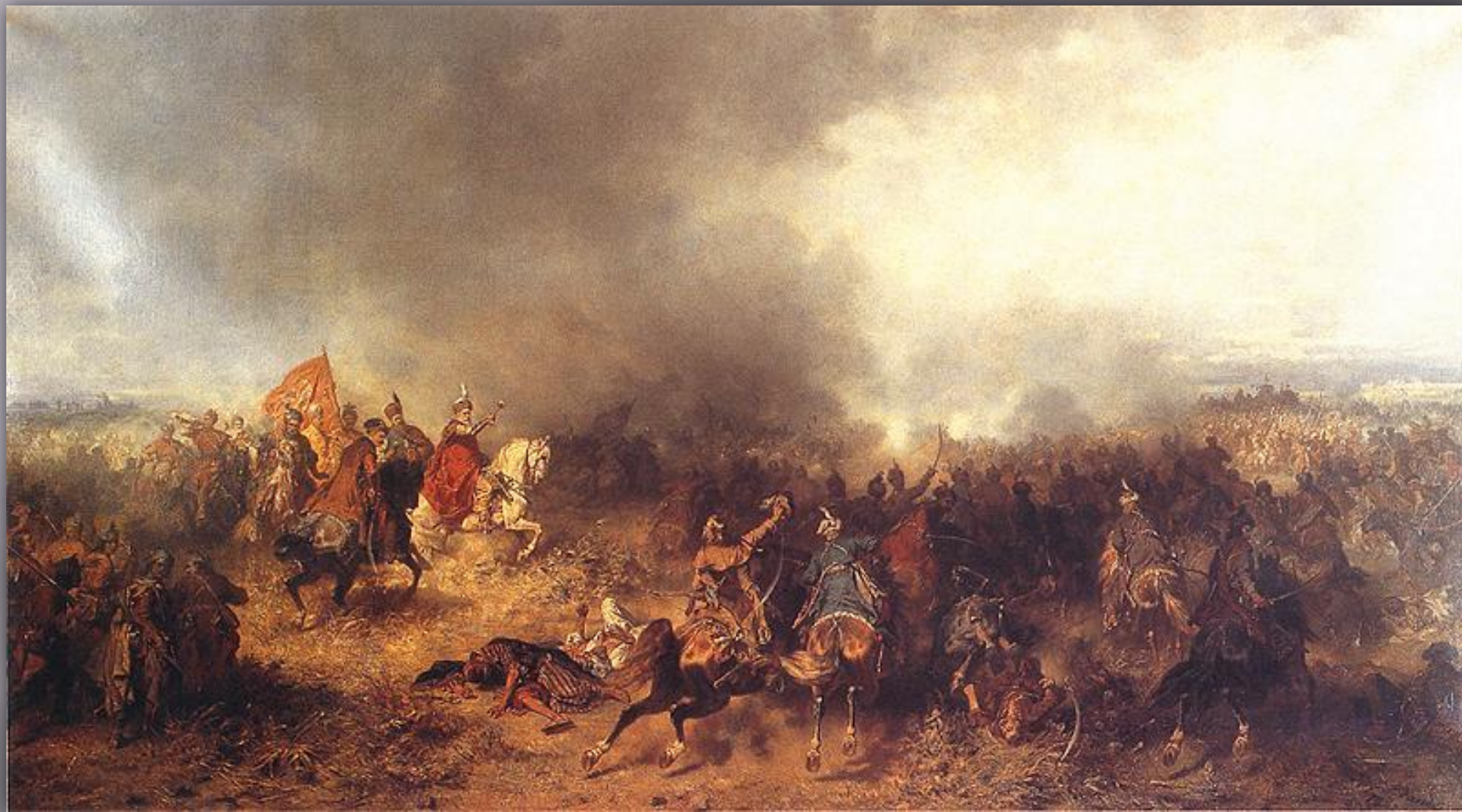
Битва під Хотиніом 1622 року