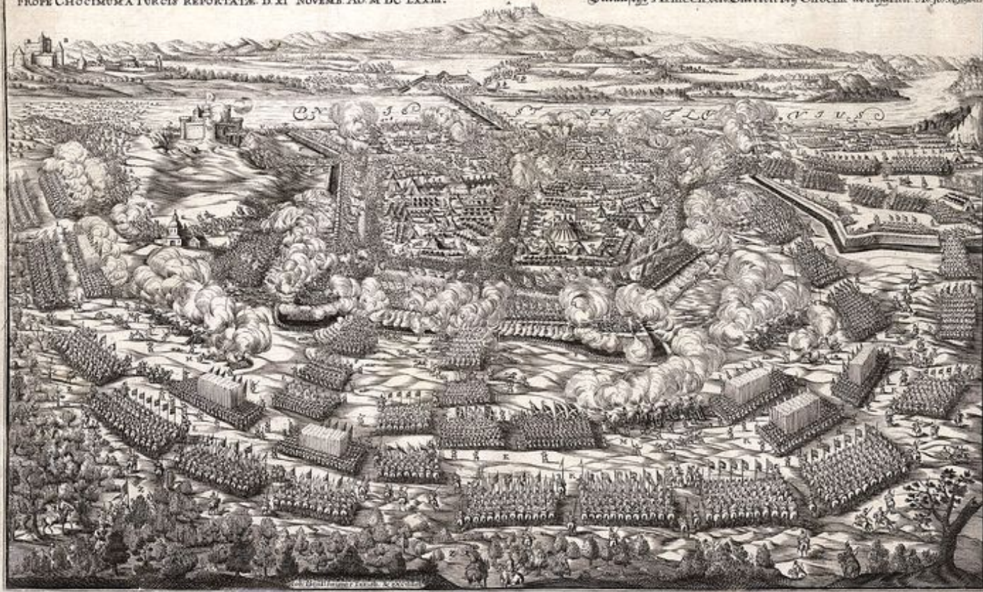
Abbildung der berühmten VICTORIÆ welche die Königl. Polnischen u. Großfürstl. Litauisch. Armeen den Türcken bey Choicim abgethan. Am 11. Novemb. 1673.

DELINEATIO IN SIGNIS VICTORIÆ, AB EXERCITU POLONICO LITHVANICO, PROPE CHOICIMUM À TURCIS REPORTATAE. D. XI. NOVEMB. AÐ. M. DC. LXXIII.