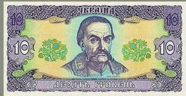
Банкнота у 10 гривень з зображенням І.С. Мазепи (найстаріший варіант, підлягає поступовому вилученню з обігу)