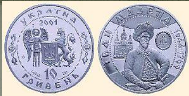
Монета 10 гривень з зображенням І.С. Мазепи