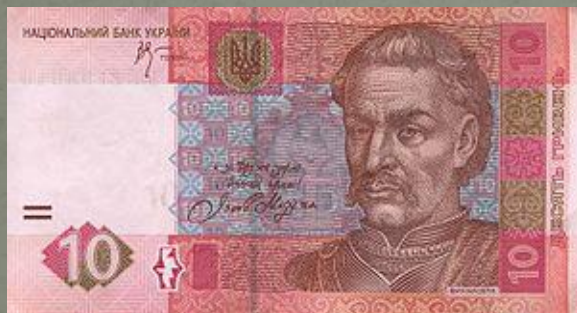
Нова банкнота у 10 гривень з зображенням І.С. Мазепи