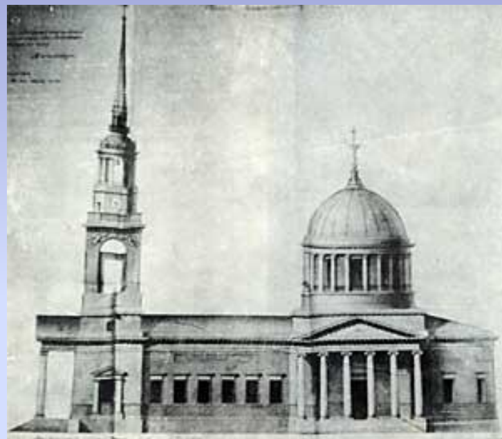
Проект Андреевского собора архитектора А.Д.Захарова. 1806 г.