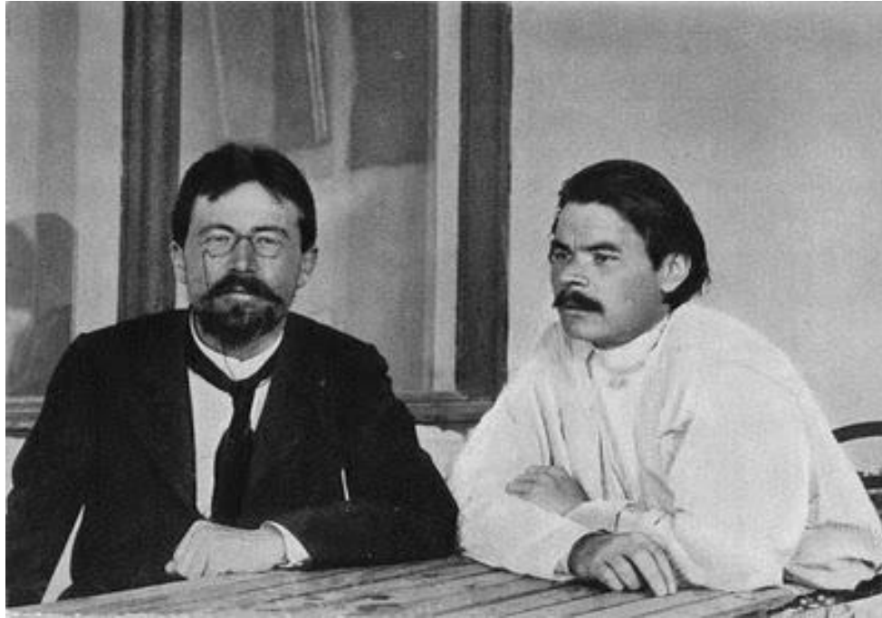
А.П. Чехов та М.Горький в Ялті

1902 р. Чехов відмовився від цього звання через те, що таке ж звання забрали у Горького, з яким він часто зустрічався в Ялті.