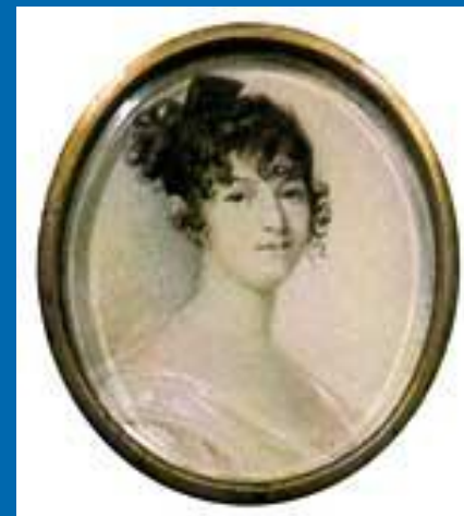
Мать, Надежда Осиповна Пушкина (1775-1836г.)