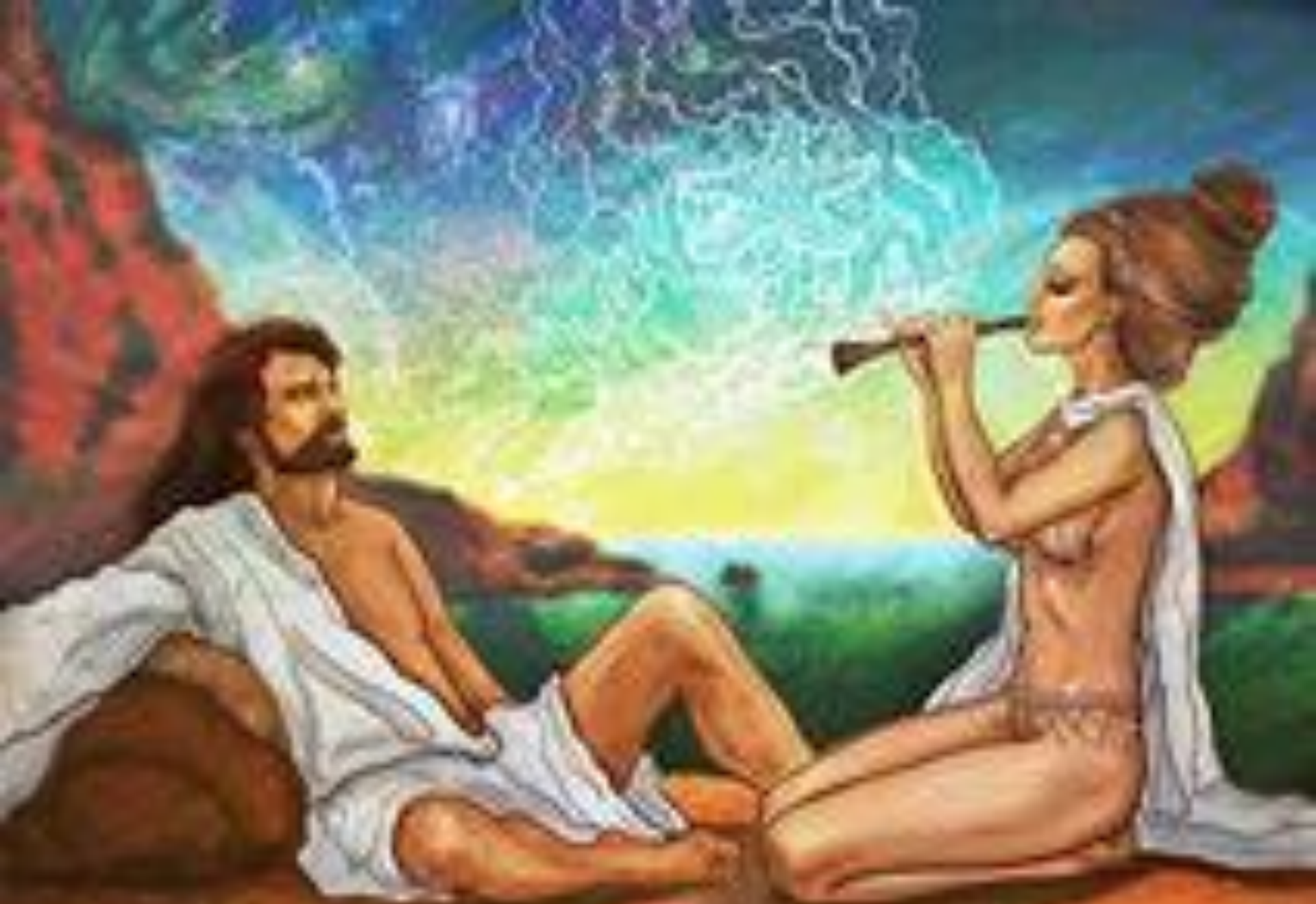
Каліпсо з Одісеєм.