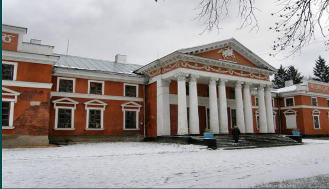
● Палац Ганської. Верхівня