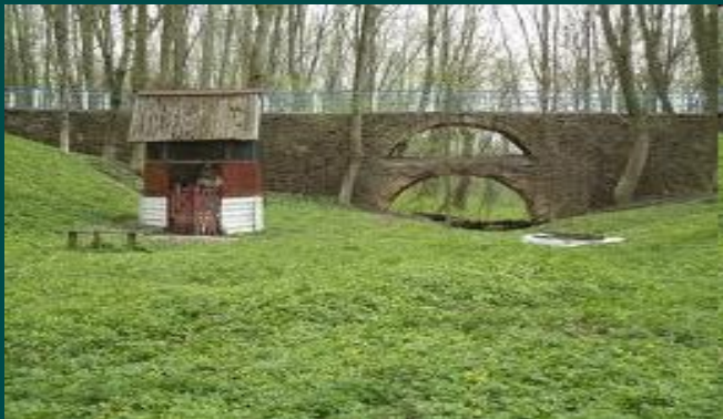
● Парковий місток