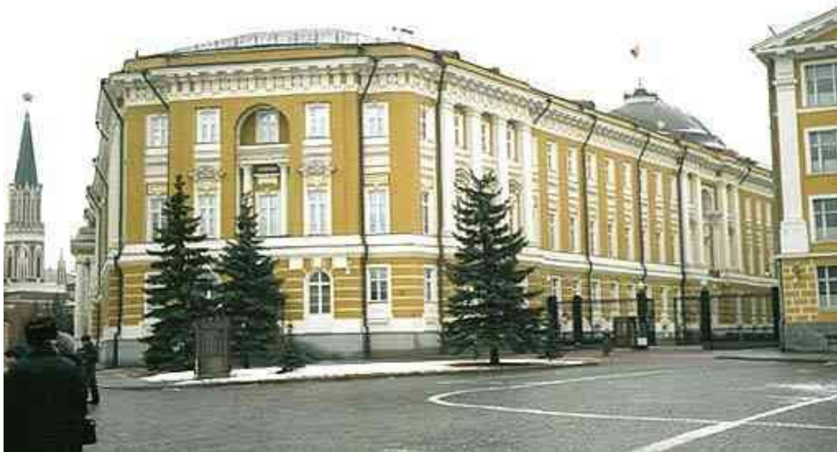
«Здание Сената в Москве»