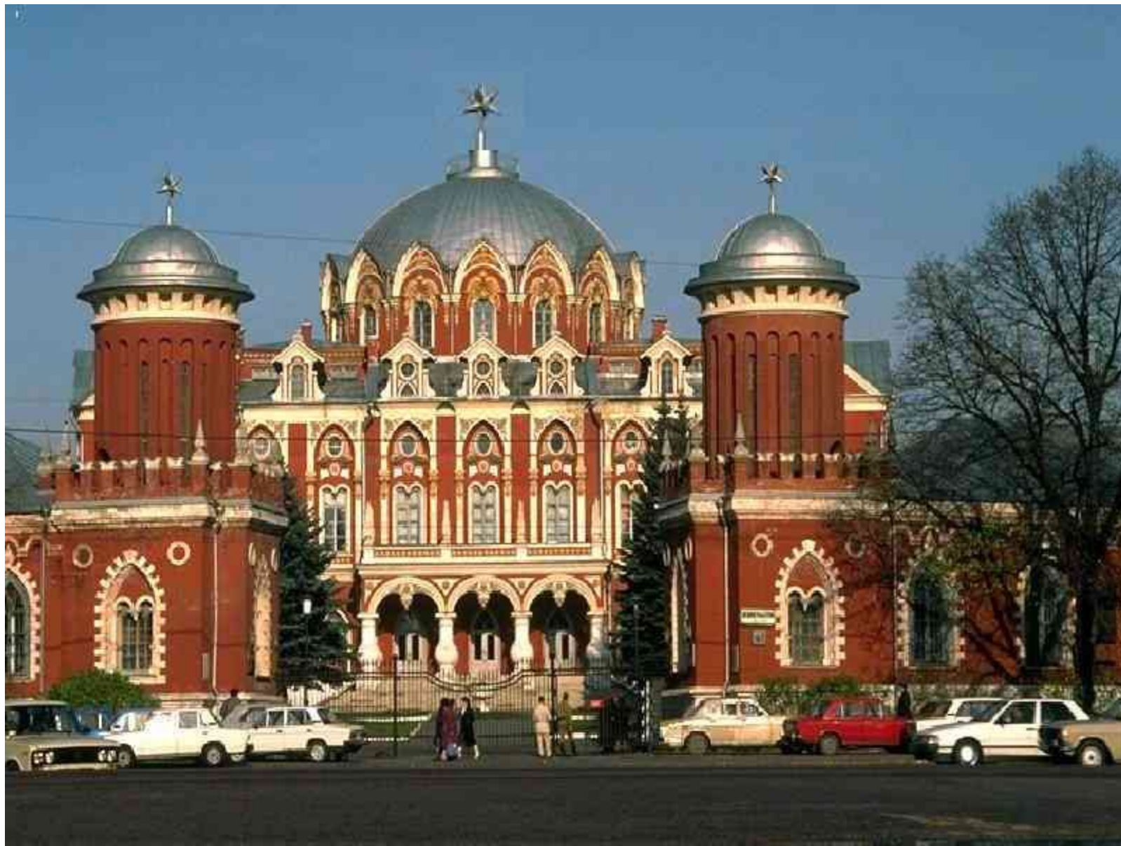
«Петровский дворец в Москве»