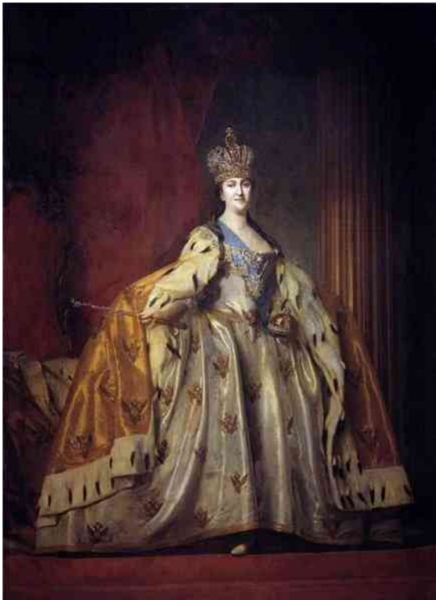
«Портрет Екатерины II»