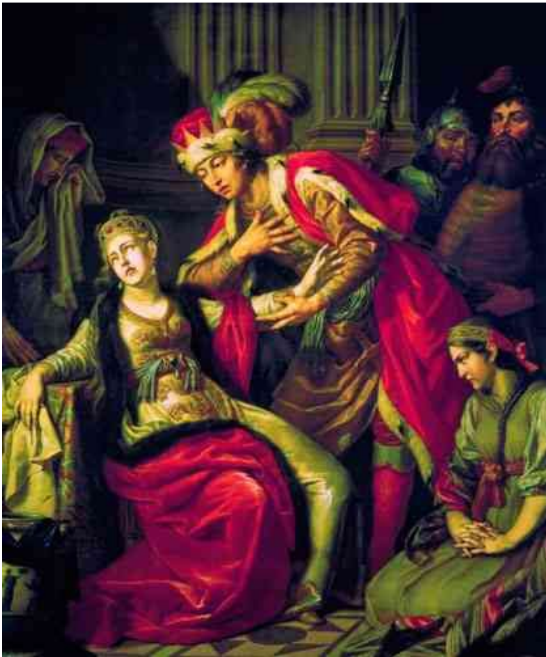
«Владимир перед Рогнедой»