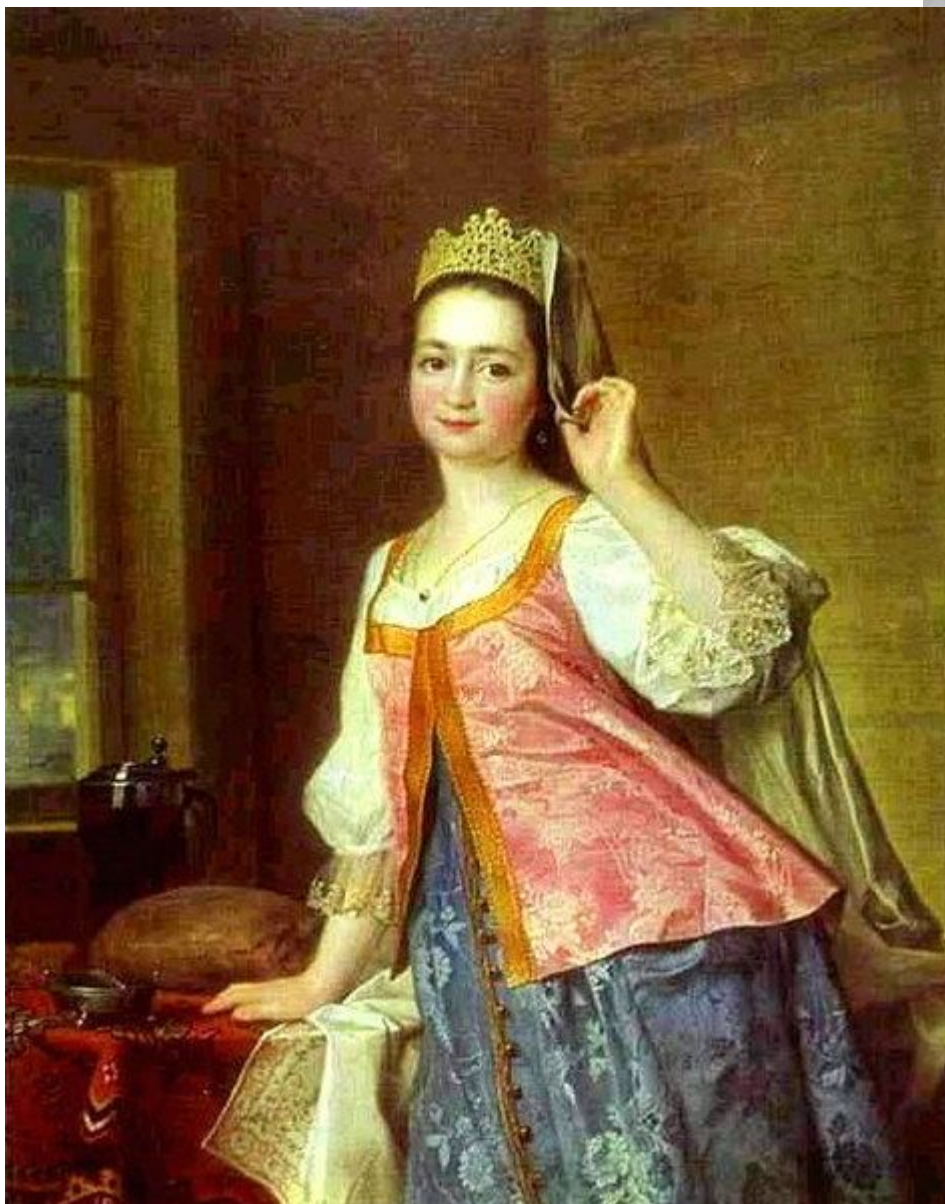
«Женщина прекрасна вне»