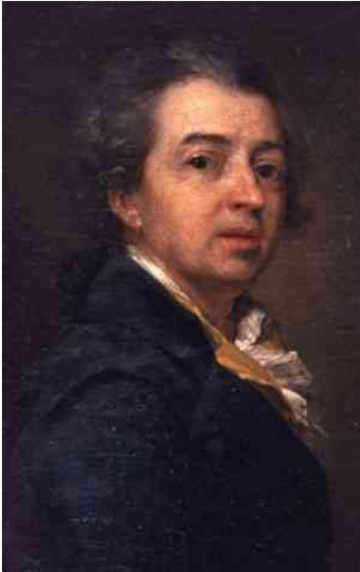
Дмитрий Григорьевич Левицкий (1735-1822)