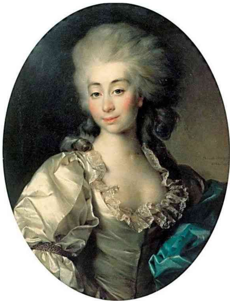
«Портрет Урсулы Мнишек»