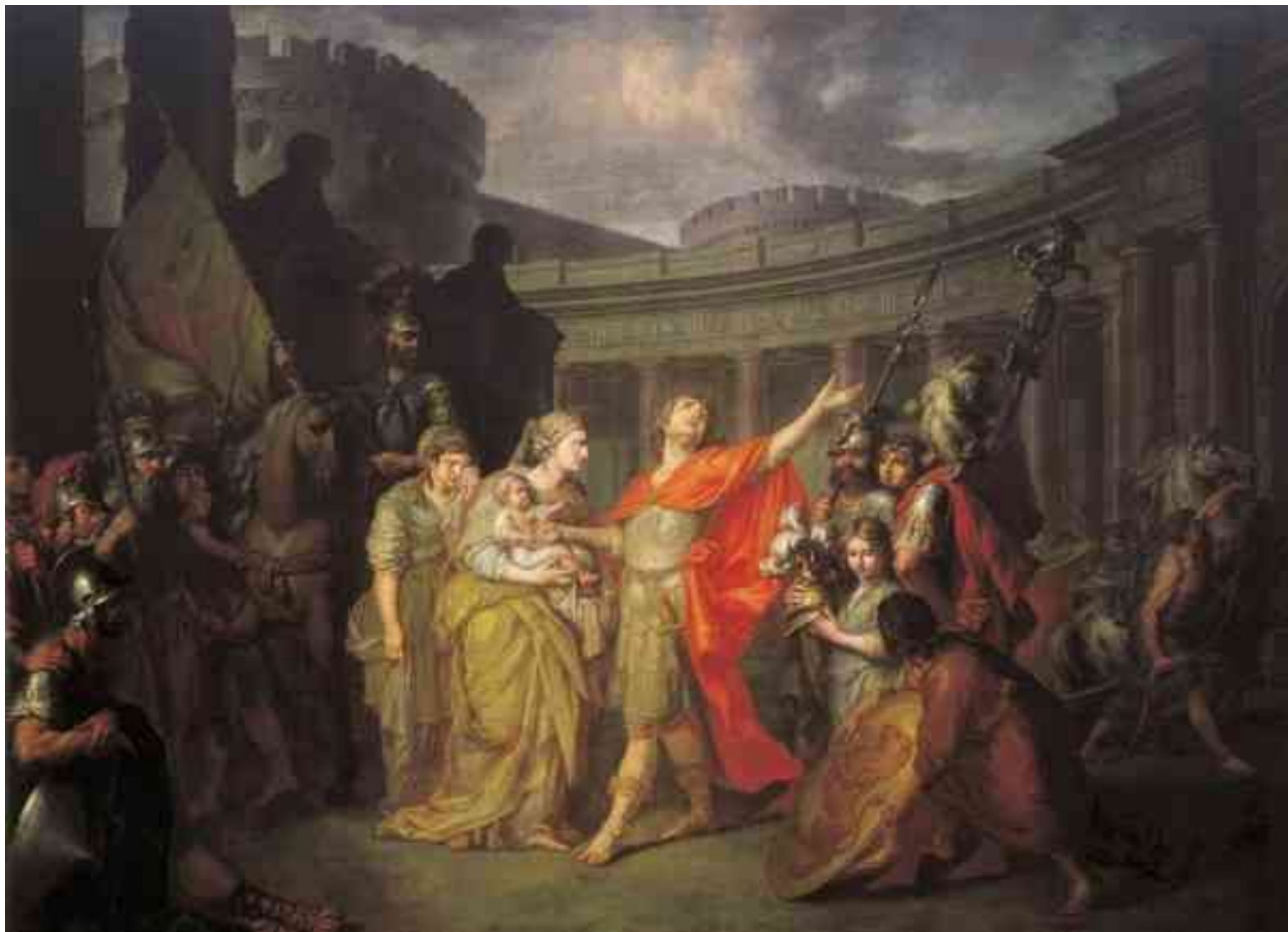
«Прщание Гектора с Андромахой»