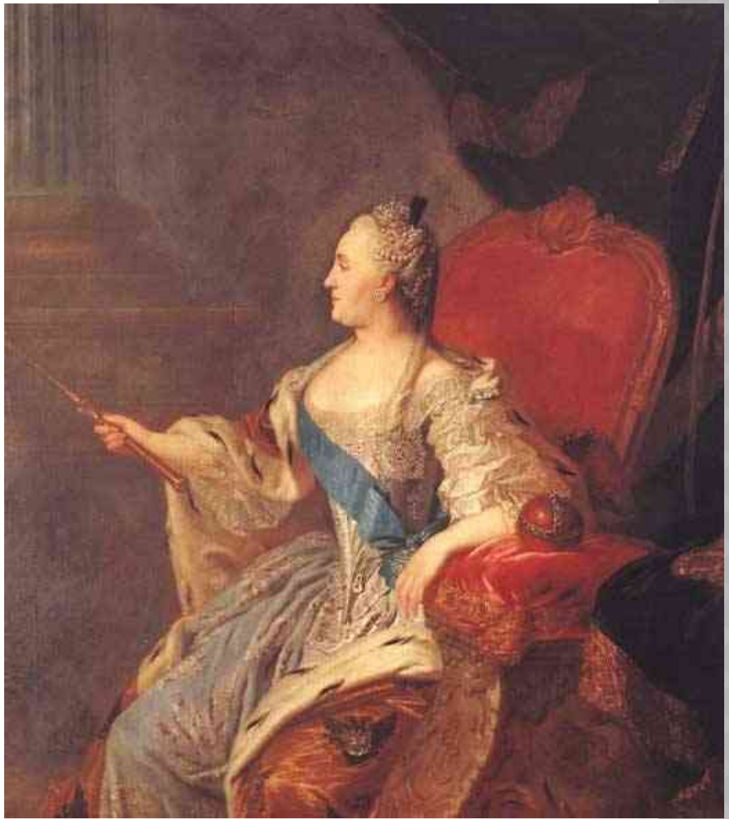
«Портрет Екатерины II»