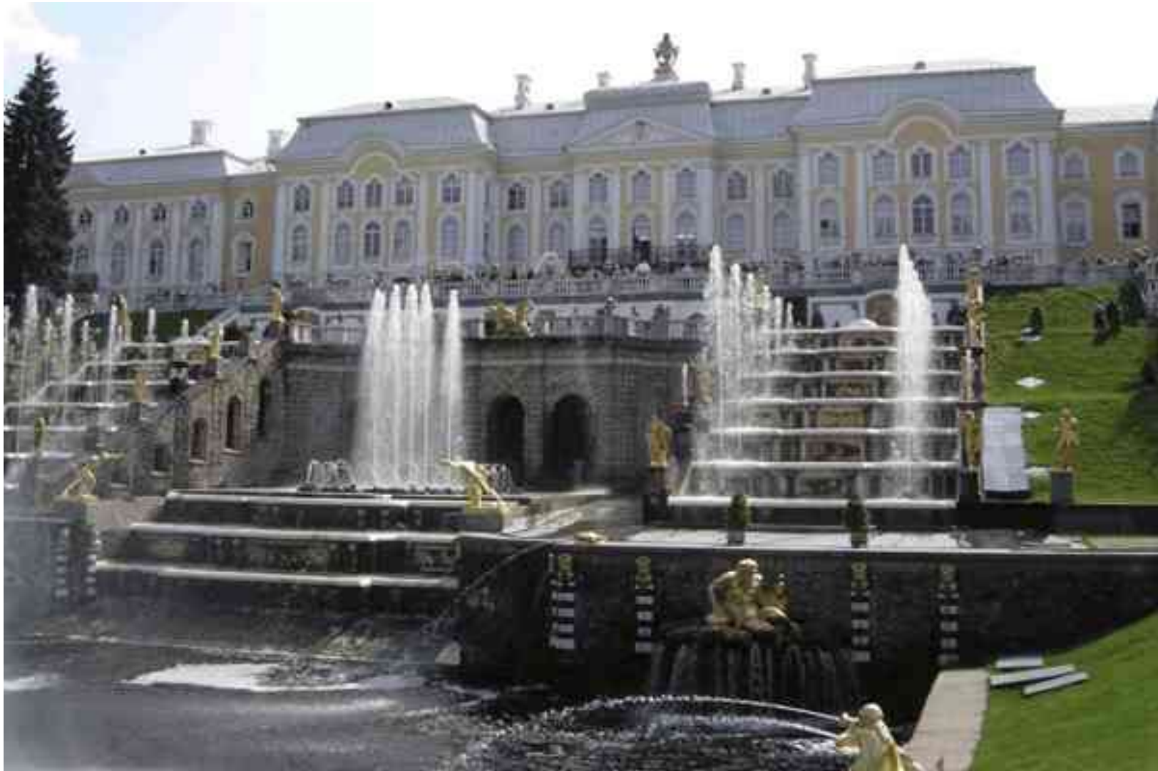
«Большой дворец в Петергофе»