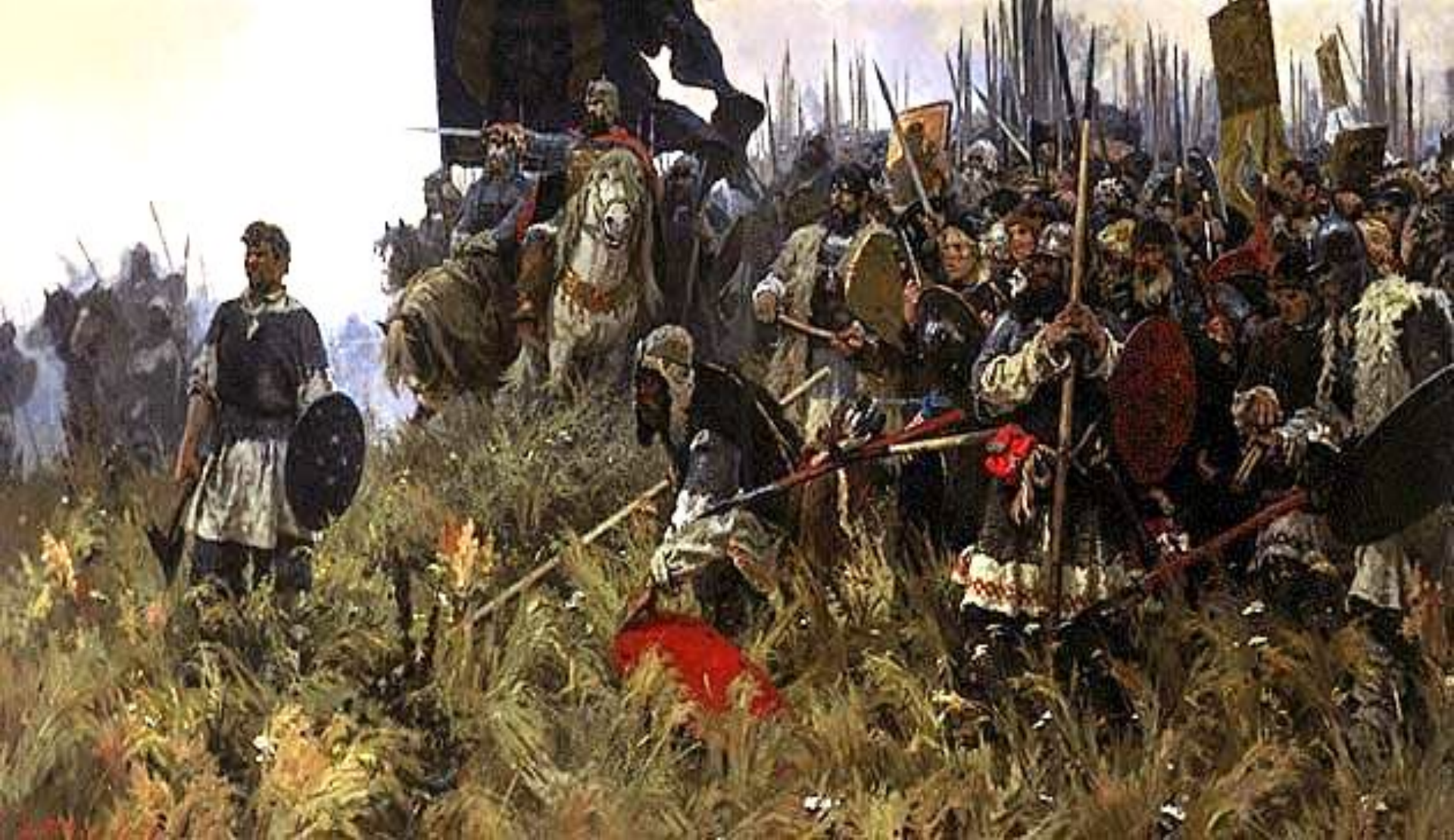
Бубнов Утро на Куликовом поле