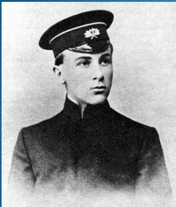
Михайло Булгаков, 1908 р.

Російський письменник українського походження, драматург, театральний режисер.