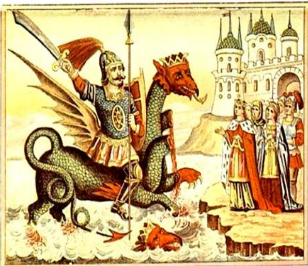
Славный Сильный и Храбрый Витязь Ерусланъ Лазаревичъ ѣдетъ на Чудо Великомъ Змѣи.

В сознании народа жило обостренное чувство