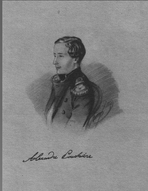
Олександр (6 липня 1833 – 19 липня 1914)