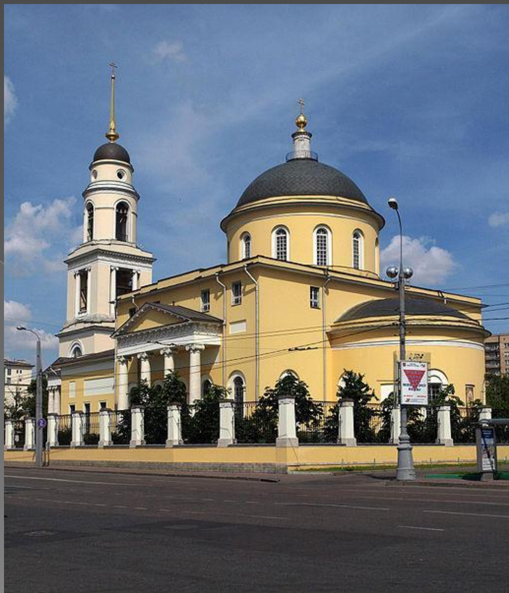
Церква Великого Вознесіння

18 лютого (2 березня) 1831 відбулося вінчання в московській церкві Великого Вознесіння біля Никітських воріт.