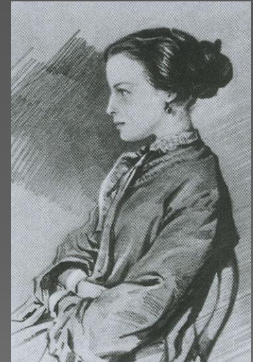
Наталья (23 мая 1836 — 10 марта 1913)