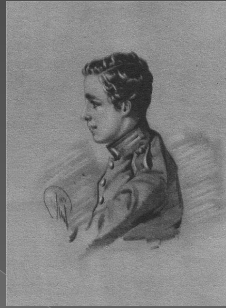
Григорій (14 травня 1835 - 5 липня 1905)