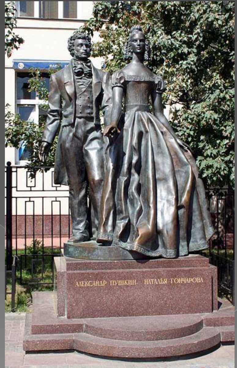
Пам'ятник А. С. Пушкіну і Н. М. Гончарової на Арбаті

Смерть чоловіка стала для Наталі Миколаївни важким потрясінням, вона захворіла. П'ятниця, день смерті чоловіка, стала траурним днем для Наталі Миколаївни.