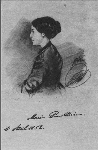
Марія (19 травня 1832 - 7 березня 1919)