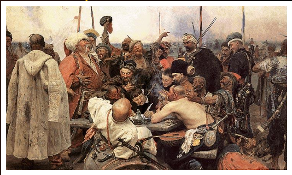
Репин «Запорожцы пишут письмо турецкому султану»