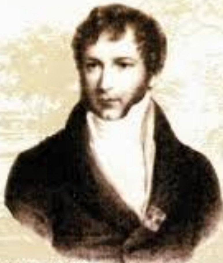
Михал Клеофас ОГИНСКИЙ