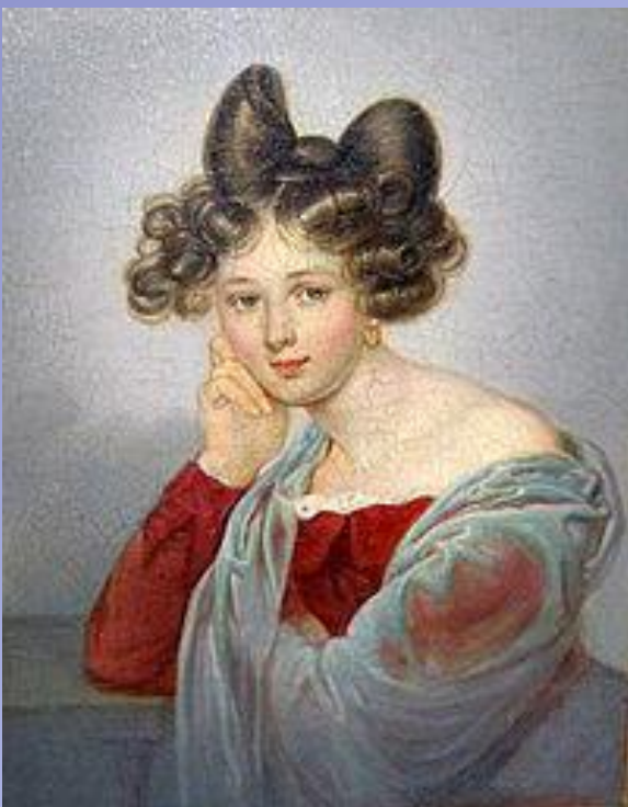
Элеонора Тютчева (Петерсон), первая жена поэта