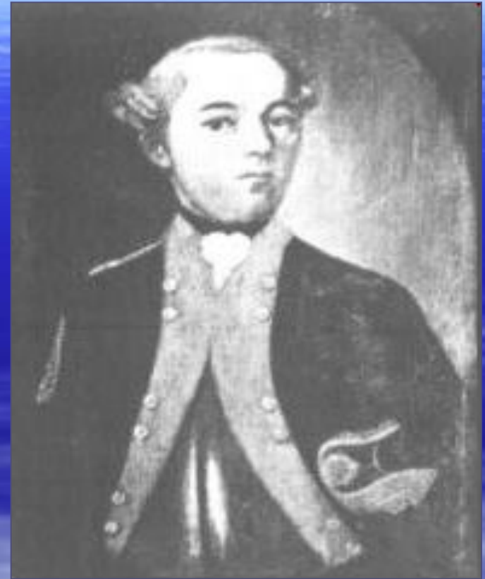
Джоанн Каспар Шіллер