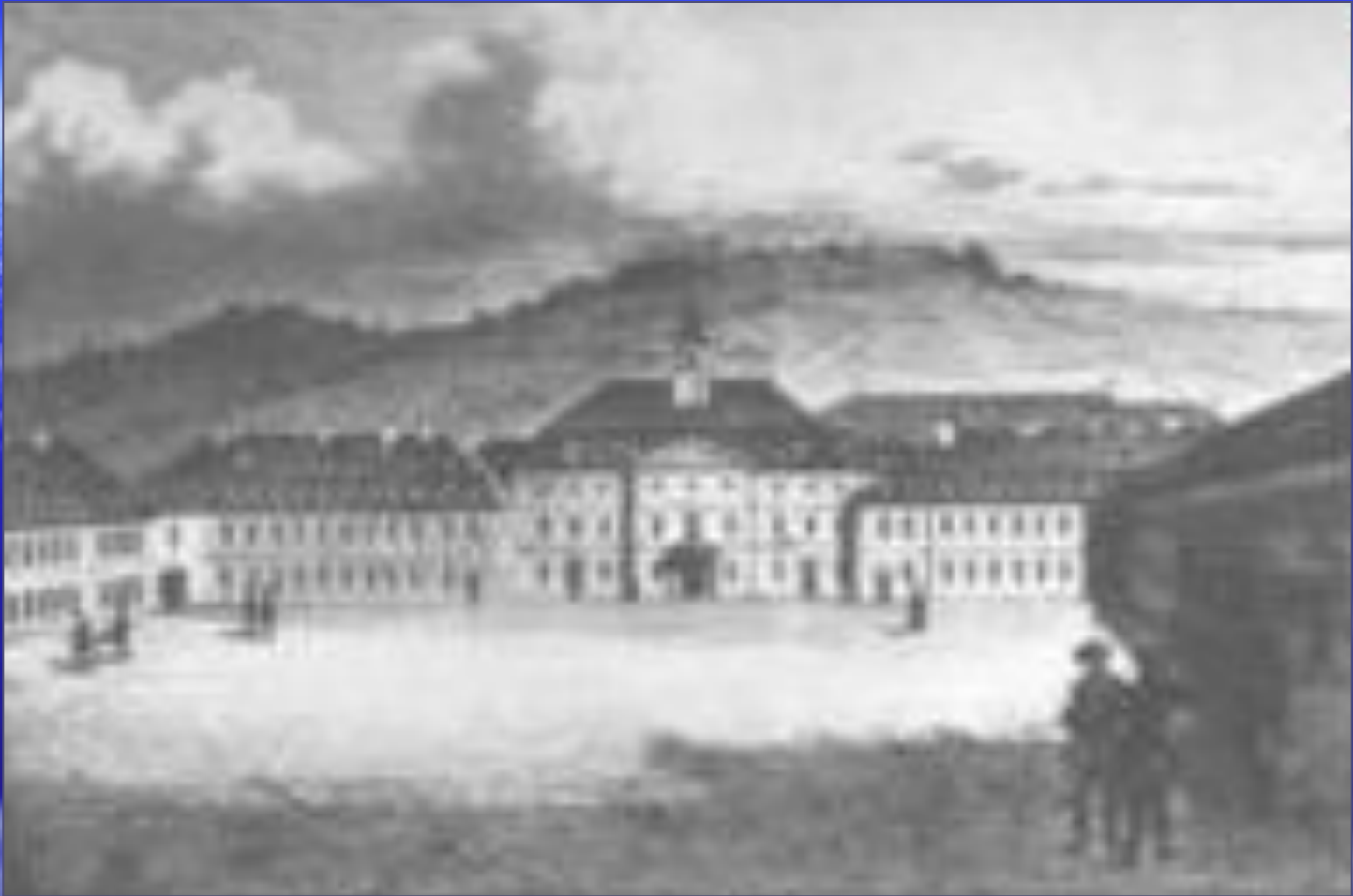
Військова академія у Штутгарті