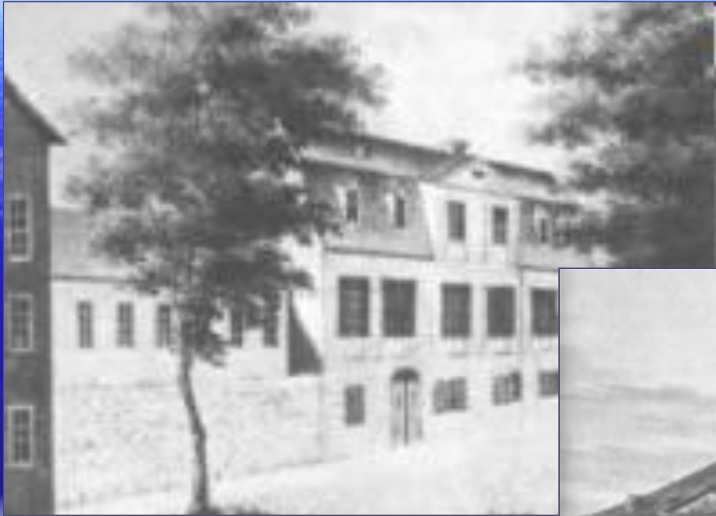
Будинок Шіллера у Веймарі