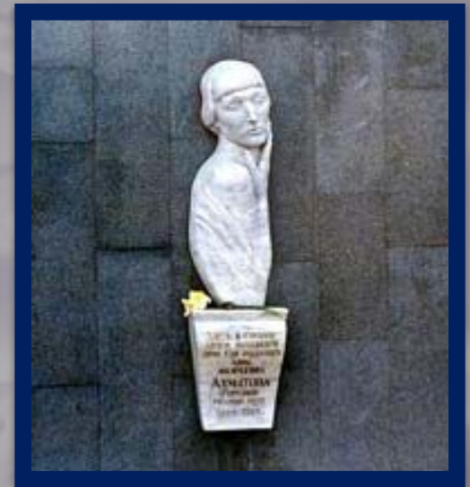
Одесса. Мемориальная доска Ахматовой

Я родилась 11 (23) июня 1889 года под Одессой (Большой Фонтан). Мой отец был в то время отставной инженер-механик флота. Годовалым ребенком я была перевезена на север - в Царское Село. Там я прожила до шестнадцати лет.