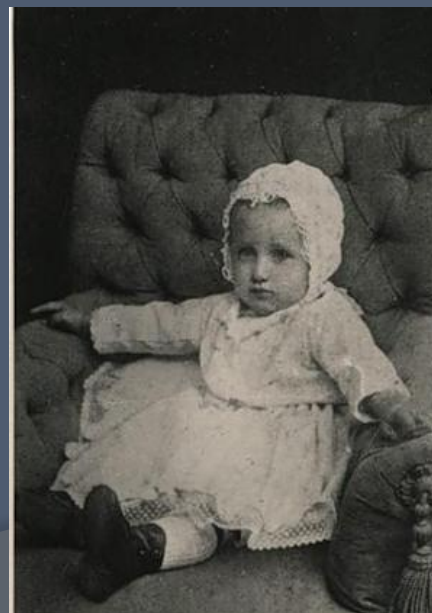
А. Ахматова в детстве